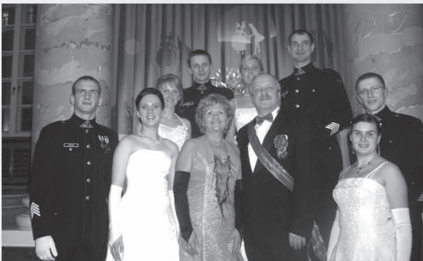
Vienos pokylio Vilniuje ambasadoriumi už ilgametį labdaros propagavimą ir rėmimą buvo išrinktas krašto apsaugos ministras Juozas Olekas

Antrą valandą nakties, tradiciškai nuskambėjus Vienos valsui „Prie žydrojo Dunojaus“, vakaras baigėsi. Tada pagal austrų paprotį buvo valgomas austriškas guliašas ir užgeriamas alumi. Po to svečiai išsikirstė po Vilniaus restoranus. O jaunimo komitetas gavo dar vieną pokylio rengėjų dovaną – kvietimus į naktinį klubą „Pabo Latino“, kur linksmai tęsė vakarą toliau šokdami šokius Lotynų Amerikos ritmais.