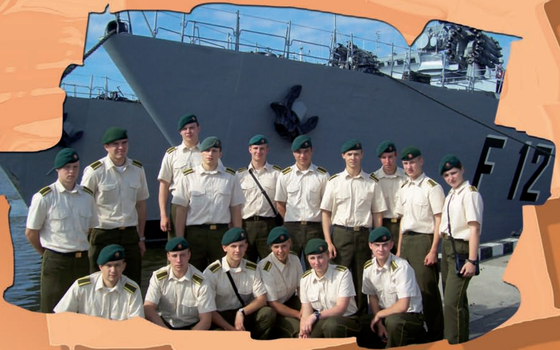
Tvirtai stovime ir sėdime ant žemės