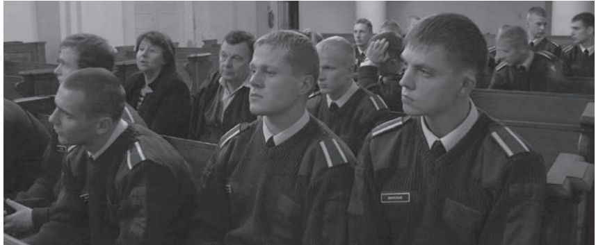
Kariūnai Vilniaus evangelikų liuteronų bažnyčioje

Atkūrus nepriklausomybę, Lietuvos liuteronai turėjo 41 veikiančią bažnyčią. Šią religinę bendruomenę sudarė apie 30 tūkst. narių. Šiuo metu Lietuvoje veikia 54 liuteronų parapijos, daugiausia jų yra Klaipėdos apskrityje. Lietuvos evangelikų liuteronų centras įsikūręs Tauragėje.