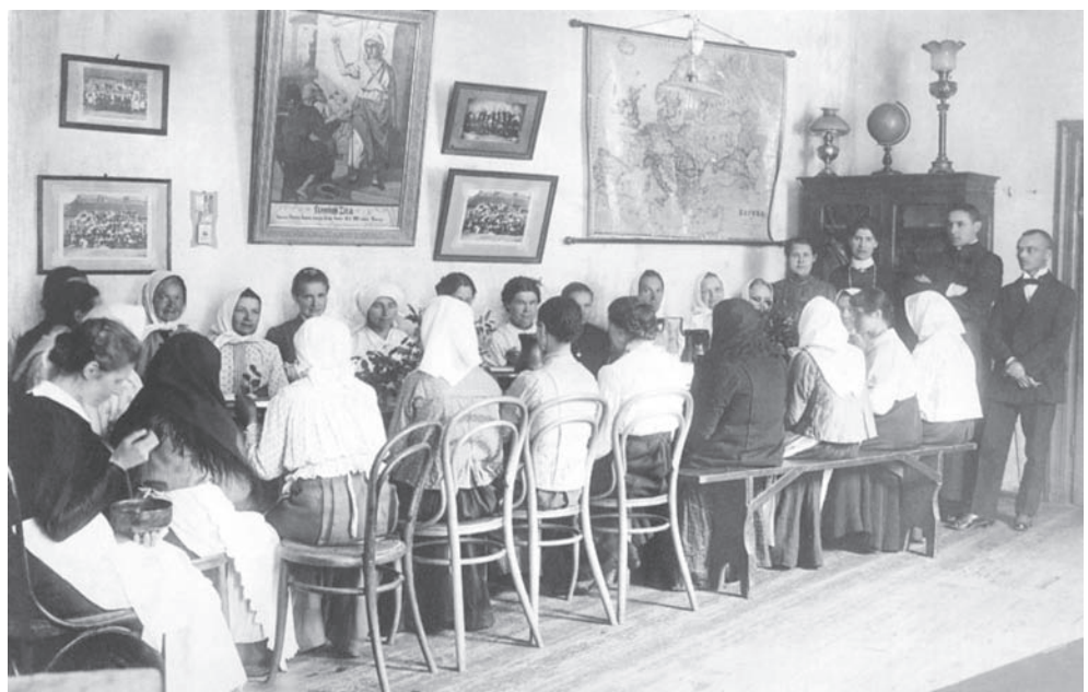
Šv. Zitos tarnaičių draugijos valgykla. Vilnius, Pirmojo pasaulinio karo metai.

Tos pačios labdaros formos egzistavo ir LDK, vėliau – Lietuvos teritorijoje. Jos galutinai išnyko sovietų ir nacių okupacijos metais.