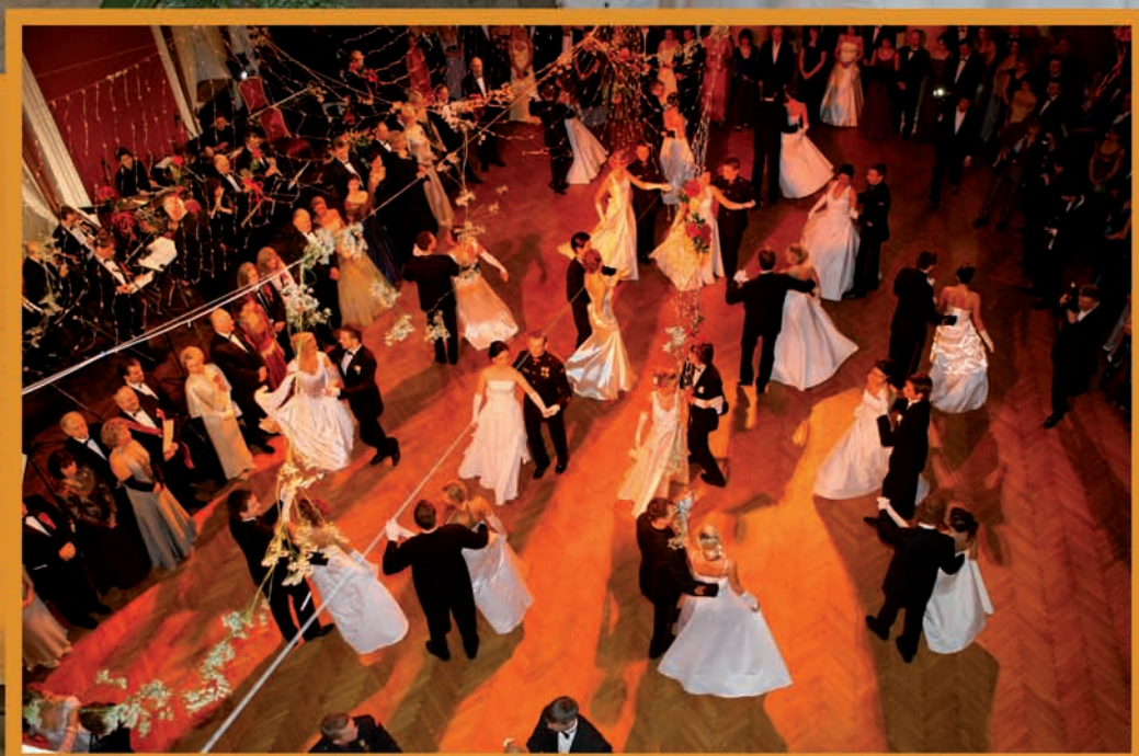
Vienos pokylis Vilniaus rotušėje