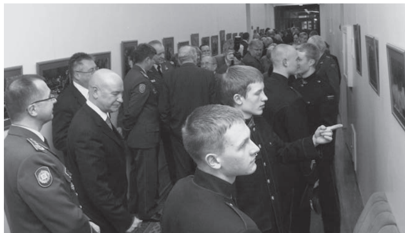
LKA fotografo Kęstučio Dijoko paroda „Seno seržanto pastebėjimai...“