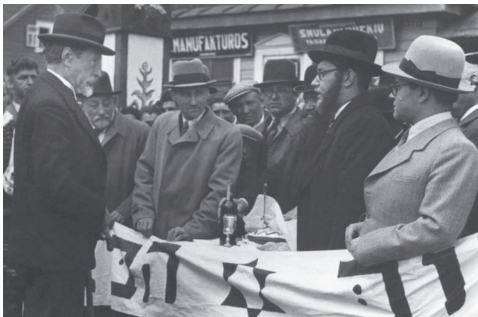
Prezidentas Antanas Smetona susitinka su žydų delegacija. Molėtai, XX a. IV dešimtmetis.

Šių formų labdara buvo labiau asmeninė. Įsidėmėtina, jog ypač dorovingi žmonės, teisuoliai, stengėsi teikti labdarą taip, kad