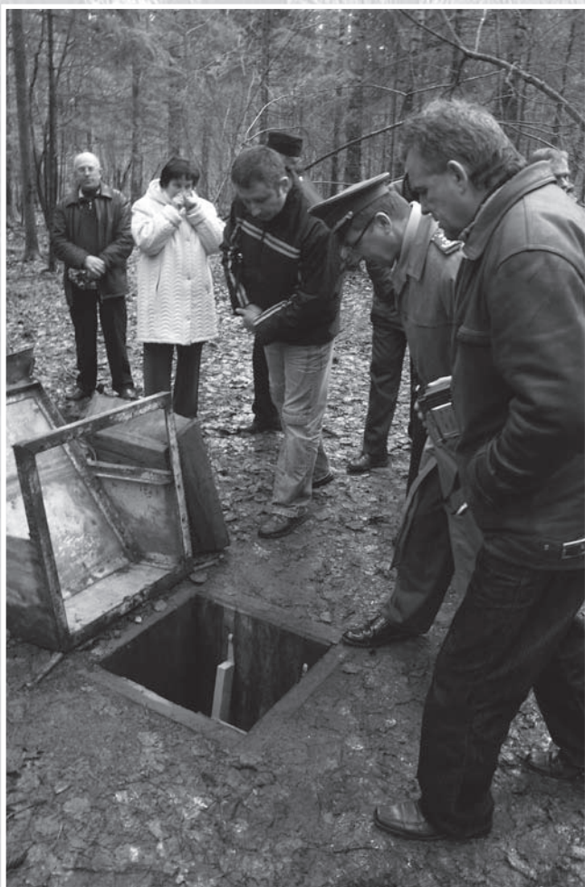
Prie gen. J. Žemaičio vadavietės slėptuvės angos