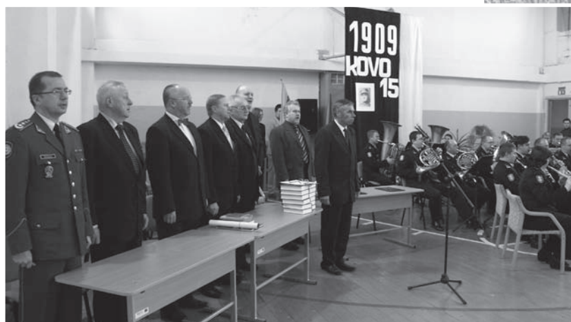
Šimkaičių Jono Žemaičio pagrindinės mokyklos salėje minint jo 99-ąsias gimimo metines. Groja Karinių oro pajėgų pučiamųjų instrumentų orkestras