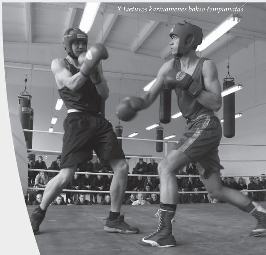
X Lietuvos kariuomenės bokso čempionatas