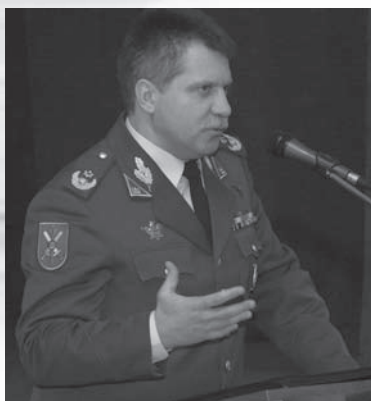
Lauko (Sausumos) pajėgų vadas brg. gen. Vytautas Jonas Žukas