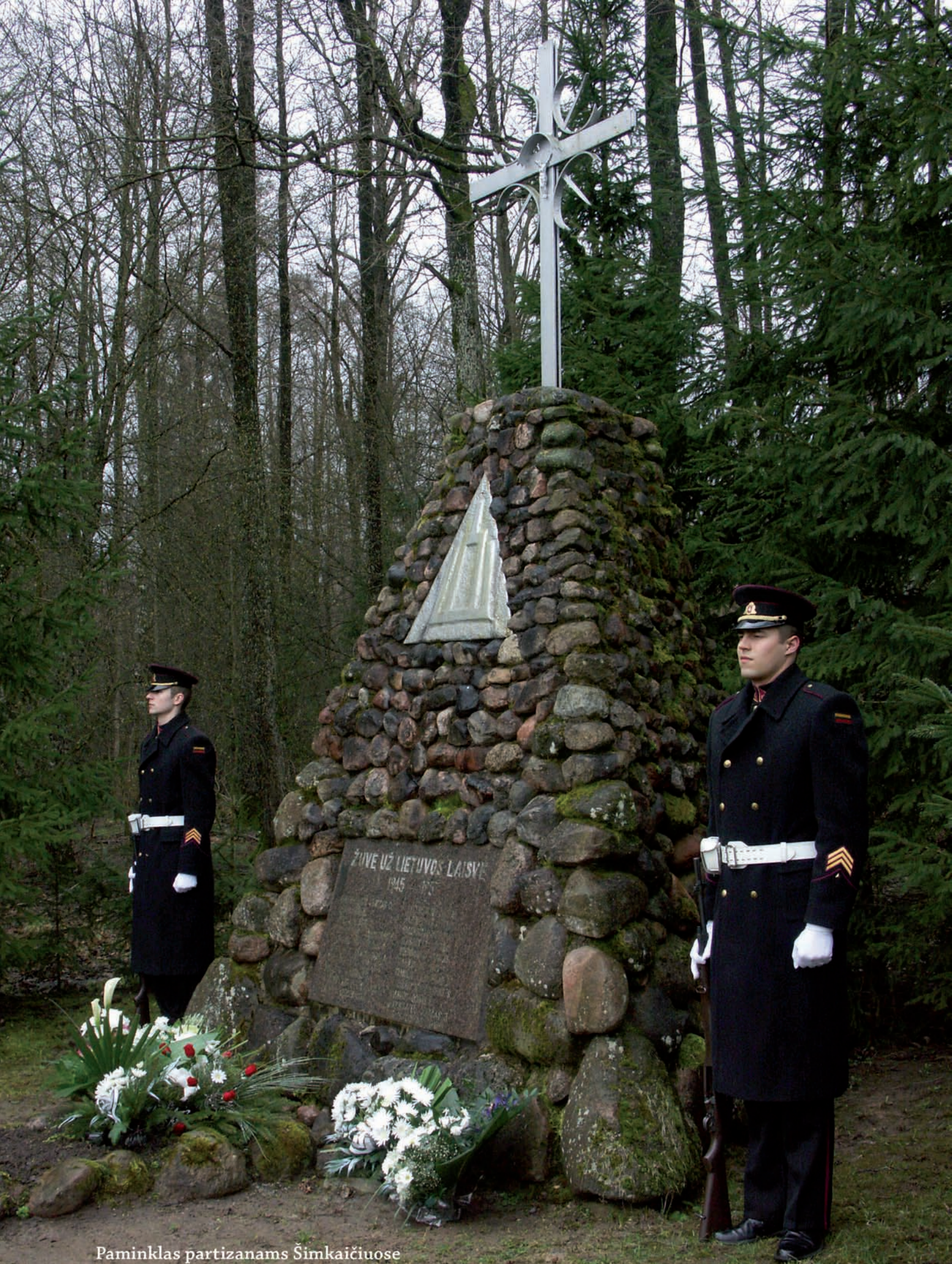
Paminklas partizanams Šimkaičiuose