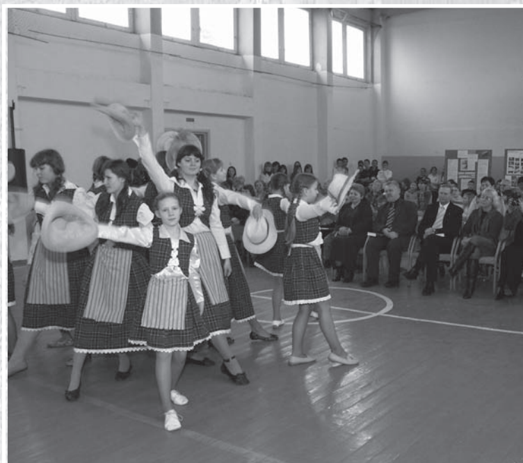
Mokinių šokis „Kepurinė“