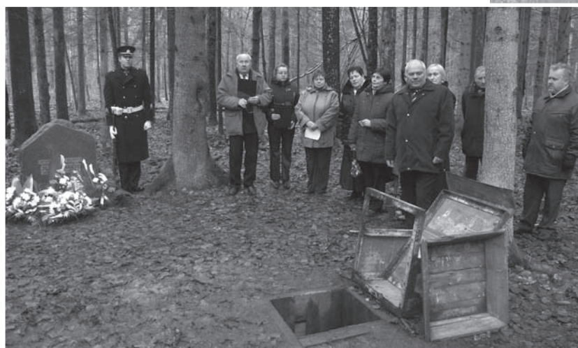
Prie gen. J. Žemaičio paminklinio akmens ir jo slėptuvės

Iš pradžių prie paminklo Šimkaičių apylinkėse žuvusiems partizanams tylos minute buvo pagerbtas jų