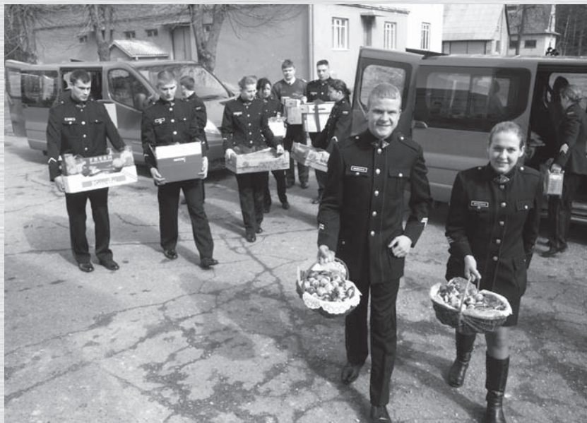
Kariūnai su dovanomis ir margučiais

Kariūnų apsilankymas Kuršėnų vaikų globos namuose per šv. Velykas nebuvo pirmasis. Kai juose viešėjome per šv. Kalėdas, po puikiai praleistos popietės vaikams pažadėjome, kad netrukus pas juos atvyksime. Tad, kur buvę, kur nebuvę, kovo 27 dieną mažuosius draugus aplankėme vėl. Žinoma, nuvykome ne tuščiomis. Karo akademijoje paskelbus gerumo akciją, visi buvo kviečiami nelikti abejingi tiems, kuriems jaukumo ir šilumos bei, būkime atviri, materialių dalykų tikrai stinga. Už surinktus pinigus nupirkome du vaizdo leistuvus su kolonėlėmis, taip pat nemažai vaikiškų filmukų DVD, kad vaikai šia dovana galėtų pasidžiaugti iš karto. Be to, nuvežėme Akademijos darbuotojų padovanotus drabužėlius, batukus ir po mažą saldumynų maišelį kiekvienam vaikų namų globotiniui. Nepamiršome ir mūsų valgyklos darbuotojų iškeptų