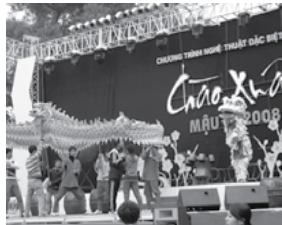
Naujieji metai Vietname