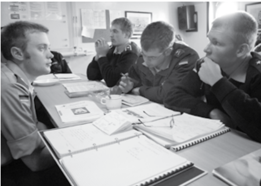
Studijų laive akimirkos

Moralinės ir fizinės stiprybės ir didelių ambicijų!