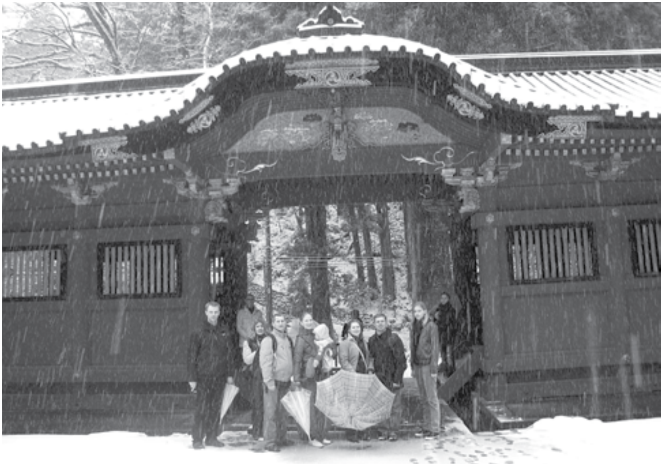
Senajoje Japonijos sostinėje Nikko

Didysis kelias atsiveria tik tiems, kurie ieško!