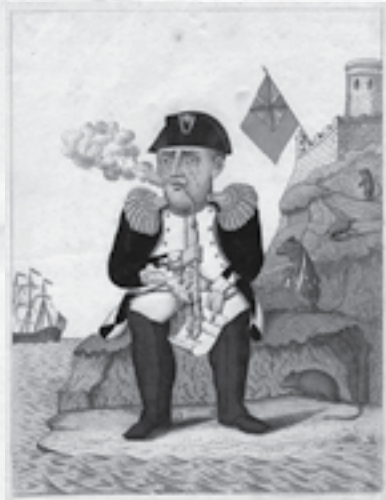
Anonimo karikatūra „Napoleonas Šv. Elenos saloje“

Napoleonas savo broliui Žeromui ( Jerome Bonaparte ) sakė, kad charakteris yra prioritetas, o „genijus“ – visų geriausių jo elementų tobula kombinacija. Jog pergalę lengva įsivaizduoti, bet sunku pasiekti. Kiekvienas pabrėžė slaptumo ir greito operatyvino tempo reikšmę (ypač strategiškai planuojant įtvirtintas vietas). Klauzevičiui Napoleonas imponavo kaip valstybės galva ir karo vadas, nors iš Frydricho jis daugiau pasimokė. Abu labai svarbiu veiksmu laikė lankstumą. Klauzevičius teigė, kad karybos principai naudingi taktikoje, bet yra daugybė skirtingų aplinkybių ir įvairių veiksmų,