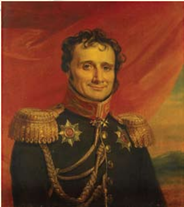
Antoine Henri de Jomini portretas iš Nancy Mitford knygos „Frederick the Great“, 1970 m.

Tas pats vėliau pasikartoję Prūsijos kovose, kuriose dalyvavo ir pats Klauzevicas: iš pradžių po Jėnos pralaimėjimo jis padėjo reorganizuoti Prūsijos kariuomenę, vėliau tarnavo Generalinio štabo karininku (1812 m.) ir pas generolą Augustą Gneizenau ( Gneisenau ) štabo viršininku. Toks pat Napoleono planas buvo ir rengiant invaziją į Rusiją. Šis žygis žlugo ne dėl vėlyvo metų laiko