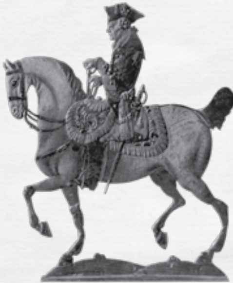
Frydrichas Didysis J. G. Hilperto skulptūros kopija

Karlas Klauzevicas ( Clausewitz ) pabrėžė, kad Frydrichas II ( Friedrich II ) ir Napoleonas įrodė, jog buvo ypač uolūs „Didžiųjų kapitonų“ skaitytojai, ir teigė, kad kiekvienam bet kokio lygio karo vadui reikėtų susipažinti su jų mąstysena, karo aplinkybėmis, veiksmų kontekstu ir psichologine būsena priimant