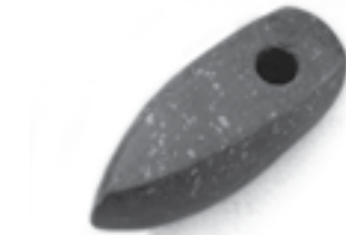
Nortikių tipo baltiškasis kovos kirvis („Lietuvos istorijos paminklai“, Vilnius, 1990)

antgalių. Gal tai sietina su mainų prekybos titnago žaliava sutrikimais?