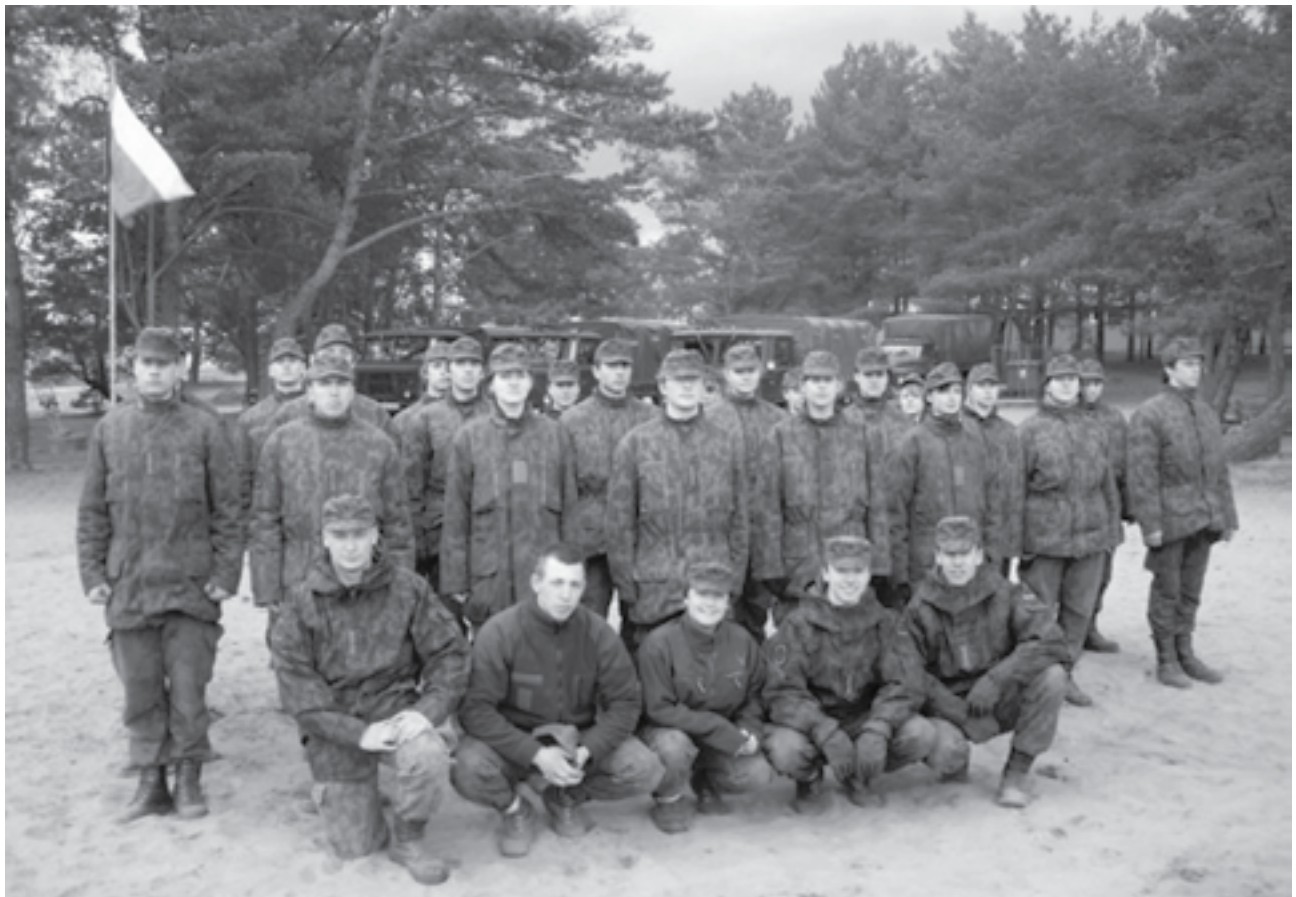
Kariūnai ir studentai pasibaigus pratyboms Pabradės poligone

Baigdamą tenoriu pridurti, kad, kaip ir visi kiti projekto dalyviai, džiaugiuosi, jog turėjau progą dalyvauti šioje konferencijoje. Ji mane įkvėpė pasamprotauti įvairiais straipsnyje iš dalies aptartais klausimais. O žadėtoji potekstė, kaip minėjau, paprasta – tai kariuomenės ir kariško patoso reikšmė Lietuvai. Ši jėga svarbi ne tik mūsų valstybės teritoriniam vientisumui užtikrinti, bet ir kitoms vertybėms, pagarbai lietuviškoms tradicijoms, Lietuvos istorijai saugoti. Kaip Victoras Hugo sakė, „ateitis – praeities atgarsis“. Turime išgirsti ir suvokti tą atgarsį ir ateityje Lietuvos labai nebe kartoti senų klaidų.