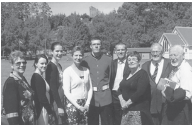
Centre Naujosios Zelandijos kariuomenės karininkas leitenantas Tanė su savo artimaisiais