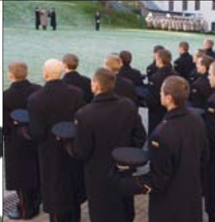
IŠ KARIŪNŲ PRIESAIKOS ŠVENTĖS • FOTOREPORTAŽAS IŠ KARIŪNŲ PRIESAIKOS ŠVENTĖS • FOTOREP