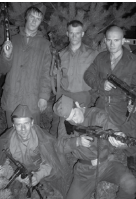
Filmuojant masinę sceną

apsirengęs ir susišukavęs, kad netinkama išvaizda ar poelgiu nepakentų savo klanų reputacijai. O Kinijoje „idealus vyras“ – tai žmogus, išmanantis karybą ir tautos meną, mokantis naudoti įvairius ginklus ir beginklės kovos būdus, išstudijavęs tradicinių kovų strategijų traktatus. Tai šeimos galva ir autoritetingas klanų vadovas, ritualų, etiketo ir meno žinovas, puikus diplomatas. Vietname iki 19 a. pabaigos kandidatai užimti postą imperatoriaus dvare tradiciškai turėjo rungtis dvikovoje su kitais pretendентаis ir nugalėti, be to – išlaikyti klasikinės literatūros, įvairių menų ir etiketo egzaminus.