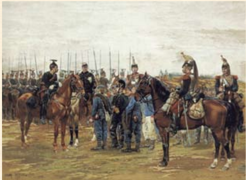
Etienne'o Dethille'o paveikslas „Prancūzijos kavalerijos karininkai (ant arklių) su pasidavusiais Bavarijos kariais“