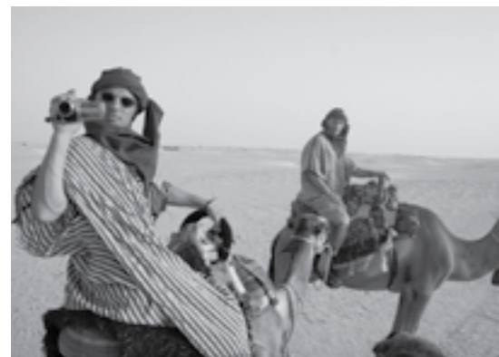
Tunise, Sacharos dykumoje