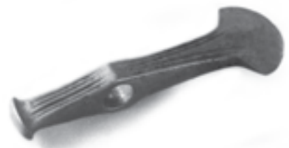
I tūkst. pr. Kr. datuojamas akmeninis kirvis, rastas Jauniūnų kaimo laukuose (Širvintų r.).

Medžioklei ir kovai plačiai naudoti lankai ir strėlės – ankstyvajame bronzos amžiuje, o galbūt ir vėlesniais laikotarpiais dar su titnaginiais antgaliais. Dalis šių antgalių kruopščiai retušuoti, kai kurie turi įkotes. Vis dėlto panašu, kad laikui bėgant populiariesni darėsi ne titnaginiai, o kauliniai ir raginiai strėlių