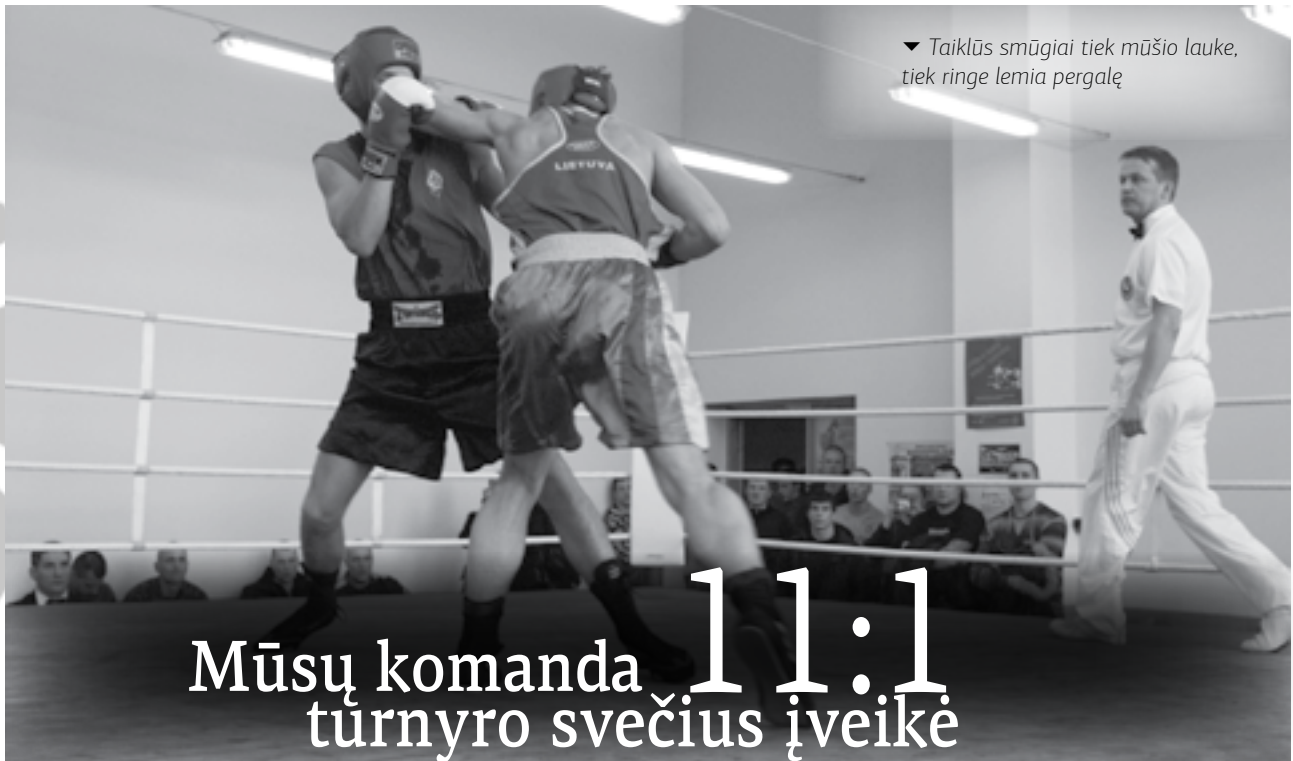
▼ Taiklūs smūgiai tiek mūšio lauke, tiek ringe lemia pergalę

jog šios sąlygos ir yra sėkmės garantas. Pergalė – nenuspėjamas dalykas, priklausantis nuo daugelio veiksnių, kurių svarbiausi – kovotojų valia, ryžtas ir atkaklumas, noras bet kokiomis priemonėmis patirti laimėjimo džiaugsmą.