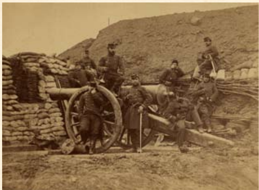
Prancūzai kariai Prancūzijos–Prūsijos 1870–1871 m. kare