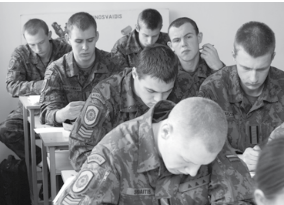
Trečio kurso kariūnai ginkluotės ir šaudybos pratybose

Taip dirbant įmanoma pasiekti ne mažiau kaip 80 proc. norimo rezultato. Tada neteks gailėtis dėl veltui iššvaistyto laiko tinginiaujant studijų metu, o įgyti gebėjimai siekiant karjeros ir pripažinimo tikrai nenuvils.