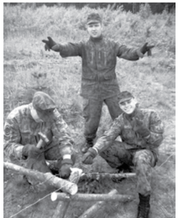
Seržanto pėstininko kurso pratybų akimirkos ▶