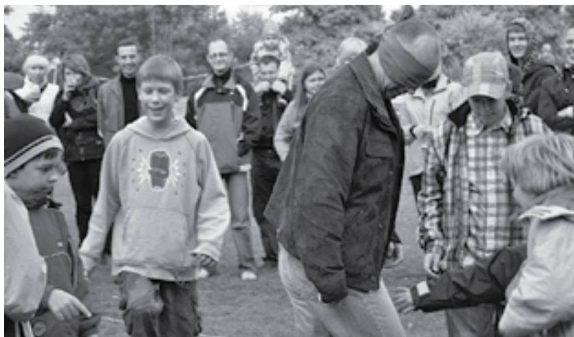
Rugsėjo 4-osios Akademijos bendruomenės tradicinės „Rudeniukės“ akimirkos