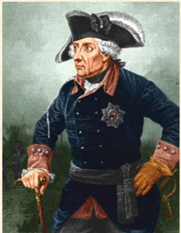
Frydricho Didžiojo portretas iš Nancy Mitford knygos „Frederick the Great“, 1970 m.

(prasidėjo jų pabaigoje), o dėl to, kad Napoleonas tuščiai prarado daug karių mūšiuose dar iki Maskvos, nepakankamai dėmesio skyrė logistikai, neužsitikrino atsitraukimo kelių. Žinoma, rusų vadų šaltakraujiškumas ir tai, kad Rusijos liaudis liko lojali caro valdžiai, taip pat tam turėjo įtakos. Jei gu Napoleonas būtų pasiekęs Maskvą turėdamas 200 000, o ne 90 000 karių, kaip galėjo nutikti (Luvaa), t. y. geriau prižiūrėjęs savo kariuomenę, galbūt būtų privertęs Michailą Kutuzovą ir Aleksandrą prašyti sudaryti taikos sutartį. Žygio atgal metu per keturias dienas buvo surengti šeši