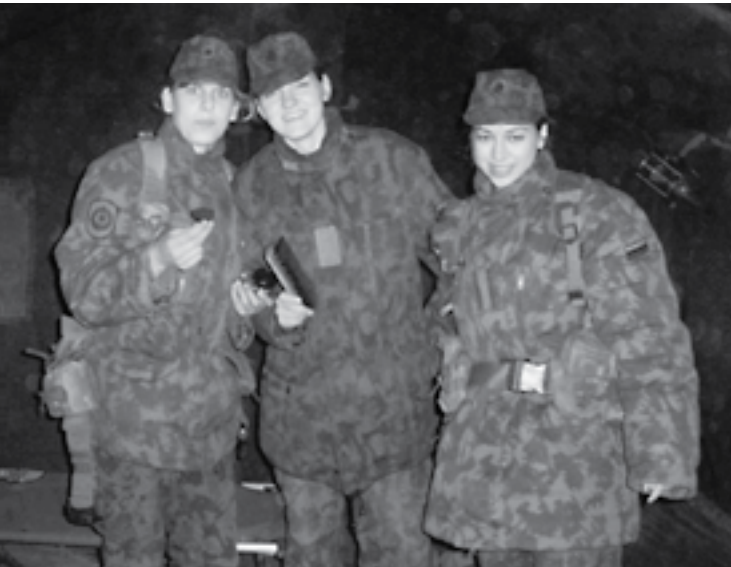
Straipsnio autorė (pirma iš dešinės) su bendrakursėmis