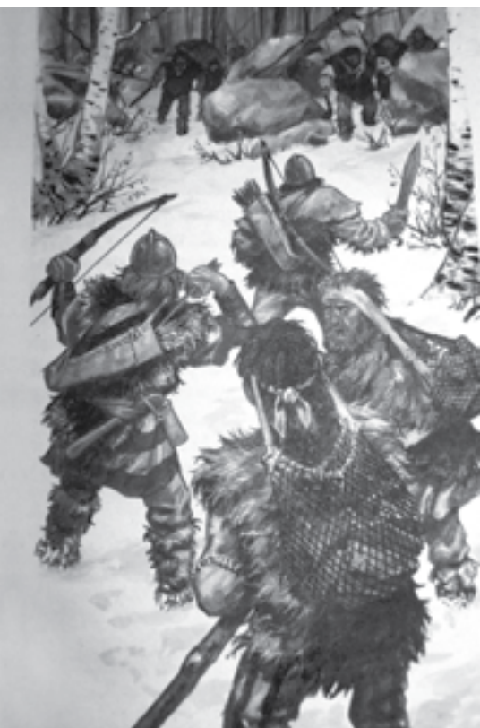
Turtingi bronzos amžiaus kariai į žygį eidavo ginkluoti ne tik lankais, strėlėmis, bet ir įmoviniais bronziniais kirviais, kalavijais („Досторические времена“, Москва, 1999)