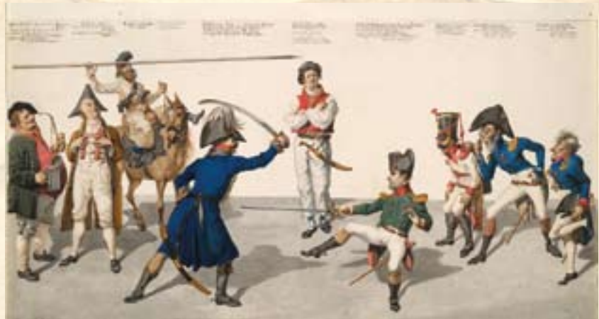
Johanno Gottfriedo karikatūra „Kovos pamokos“