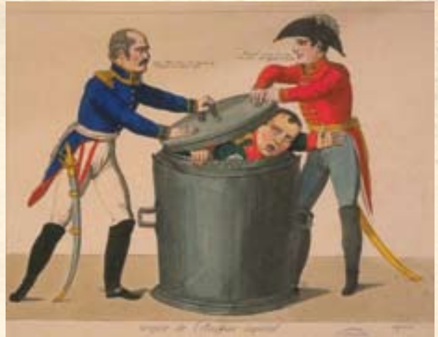
Johanno Gottfriedo karikatūra „Kylantis iš imperijos tvankios aplinkos“