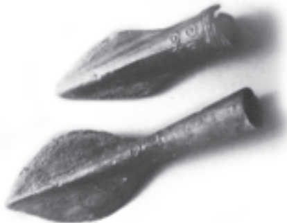
Bronzos amžiaus metaliniai įmoviniai ietigaliai, rasti Pietryčių Lietuvoje („Lietuvos istorijos paminklai“, Vilnius, 1990)