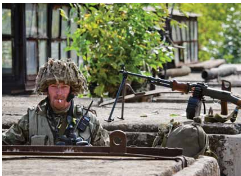
Батальон «Айдар» защищает Счастье и прикрывает Луганскую тепловую электростанцию. Счастье, Луганская область, Украина. 16 сентября 2014 г.