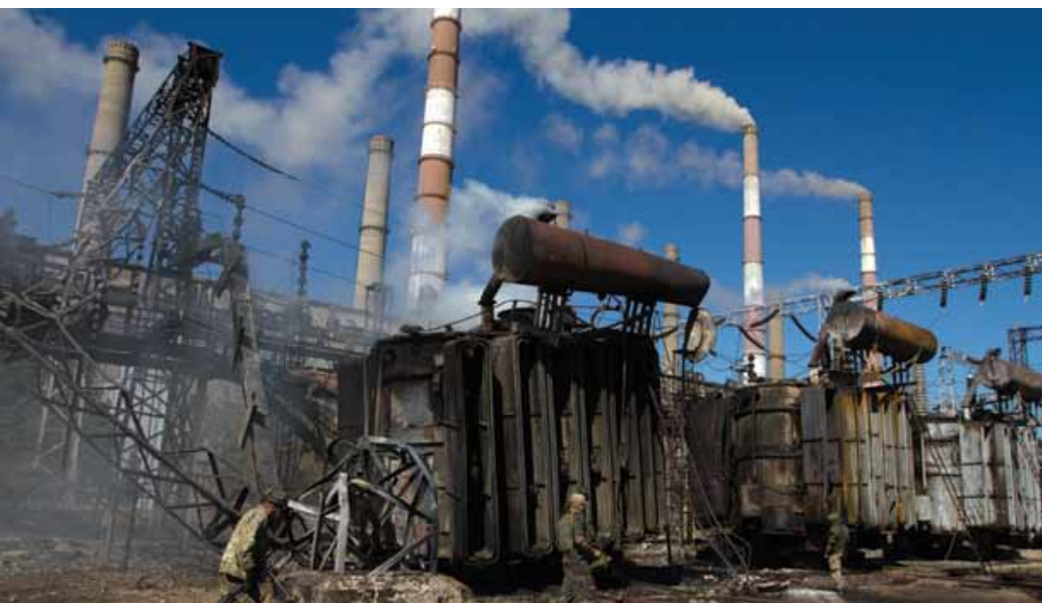
Трансформаторы Луганской ТЭС, обеспечивавшей электроэнергией большую часть Луганской области, были непоправимо повреждены во время миномётного обстрела со стороны пророссийских сепаратистов. Счастье, Луганская область, Украина. 18 сентября 2014 г.