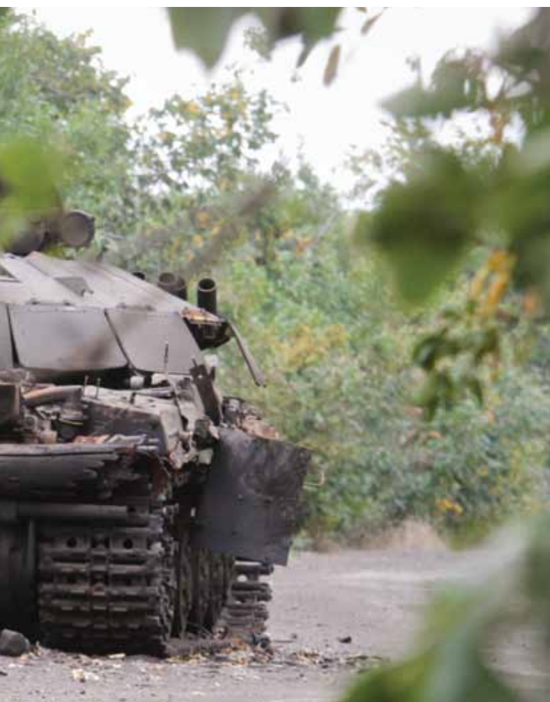
Танк украинских войск, подбитый пророссийскими террористами, на дороге из Счастья в деревню Дмитровка. Луганская область, Украина. 13 сентября 2014 г.