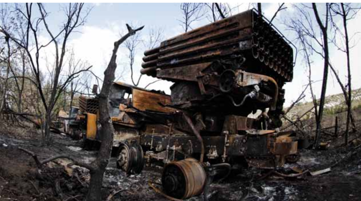
Обстрелянная из российских ракетных систем залпового огня БМ-21 «Град» и уничтоженная идентичная украинская военная техника. Дмитровка, Донецкая область, Украина. 13 сентября 2014 г.