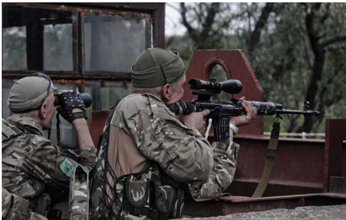
Бойцы батальона «Айдар», защищающие Счастье и прикрывающие Луганскую тепловую электростанцию. Счастье, Луганская область, Украина. 16 сентября 2014 г.