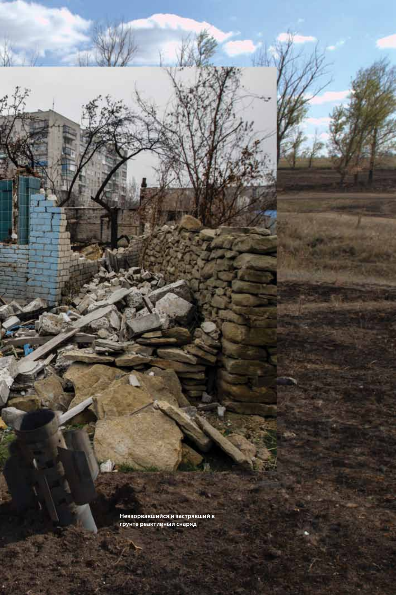
Невзорвавшийся и застрявший в грунте реактивный снаряд