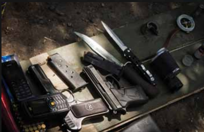
Вещи, конфискованные украинскими военными у предполагаемых сепаратистов недалеко от Славянска