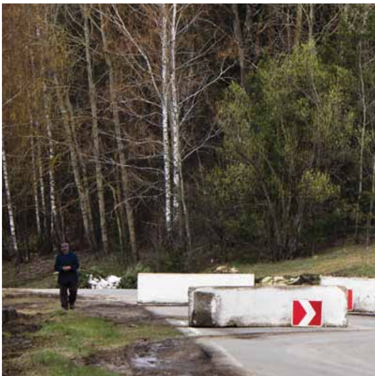
Танки, замаскированные у дороги недалеко от Украинско - Российской границы