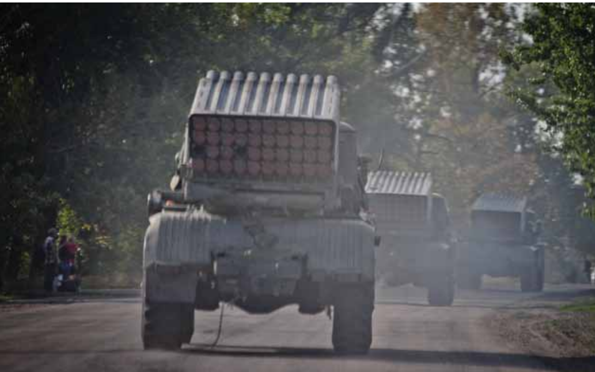
Ракетные системы залпового огня БМ-21 «Град» в Луганском регионе. Луганск, Украина. 12 сентября.