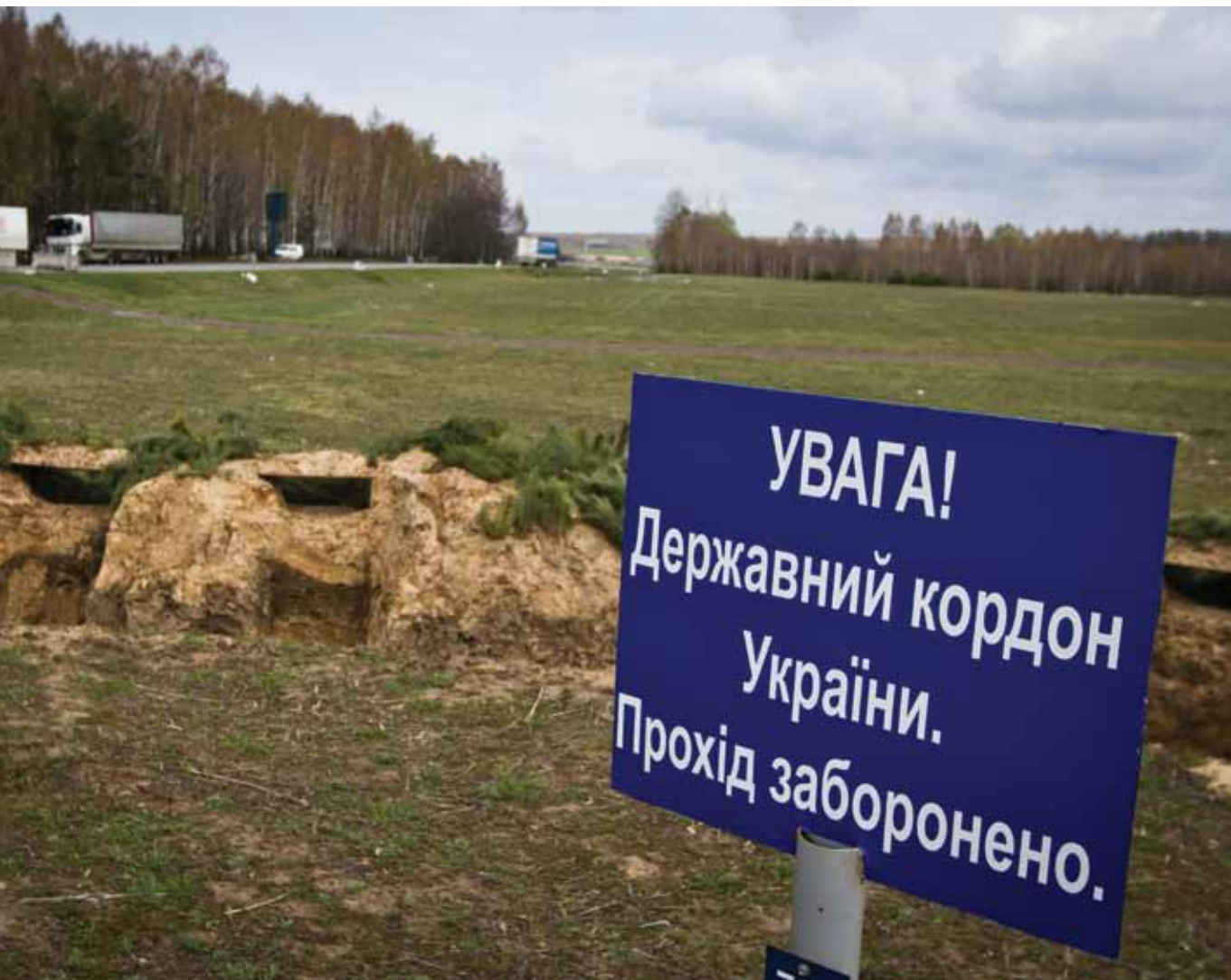
Знак «Внимание! Государственная граница Украины. Пересекать запрещается» перед укреплениями пехотинцев