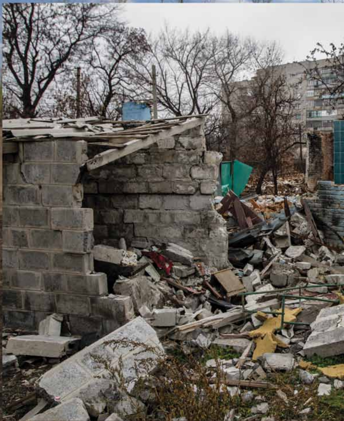
Дом, разрушенный во время артиллерийского обстрела. Жители Дебальцево начали возвращаться к обычной жизни после прекращения обстрела пророссийскими сепаратистами, который продолжался с середины лета до ноября. Дебальцево, Донецкая область, Украина. 14 ноября 2014 г.