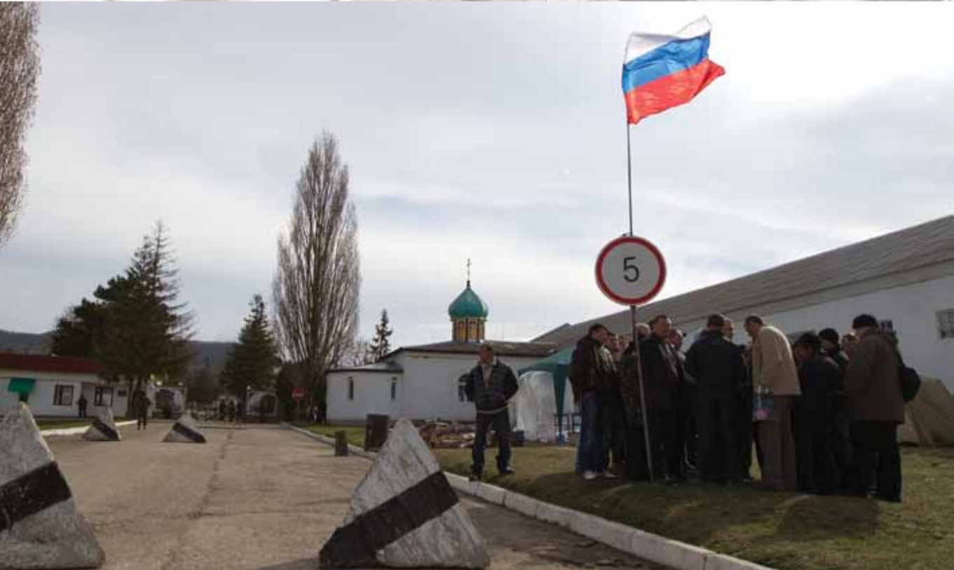
Крымские пророссийские активисты подняли флаг Российской Федерации рядом с одной из частей Вооружённых сил Украины