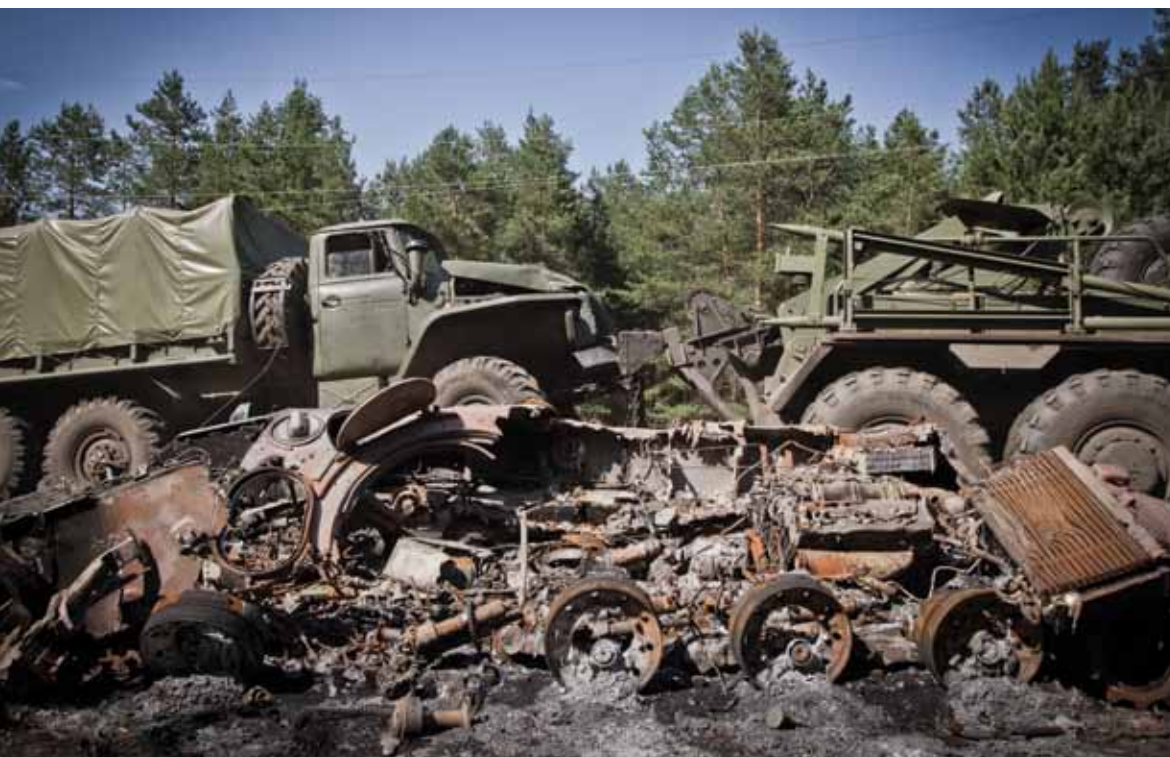
Боевой транспорт в пригороде Славянска