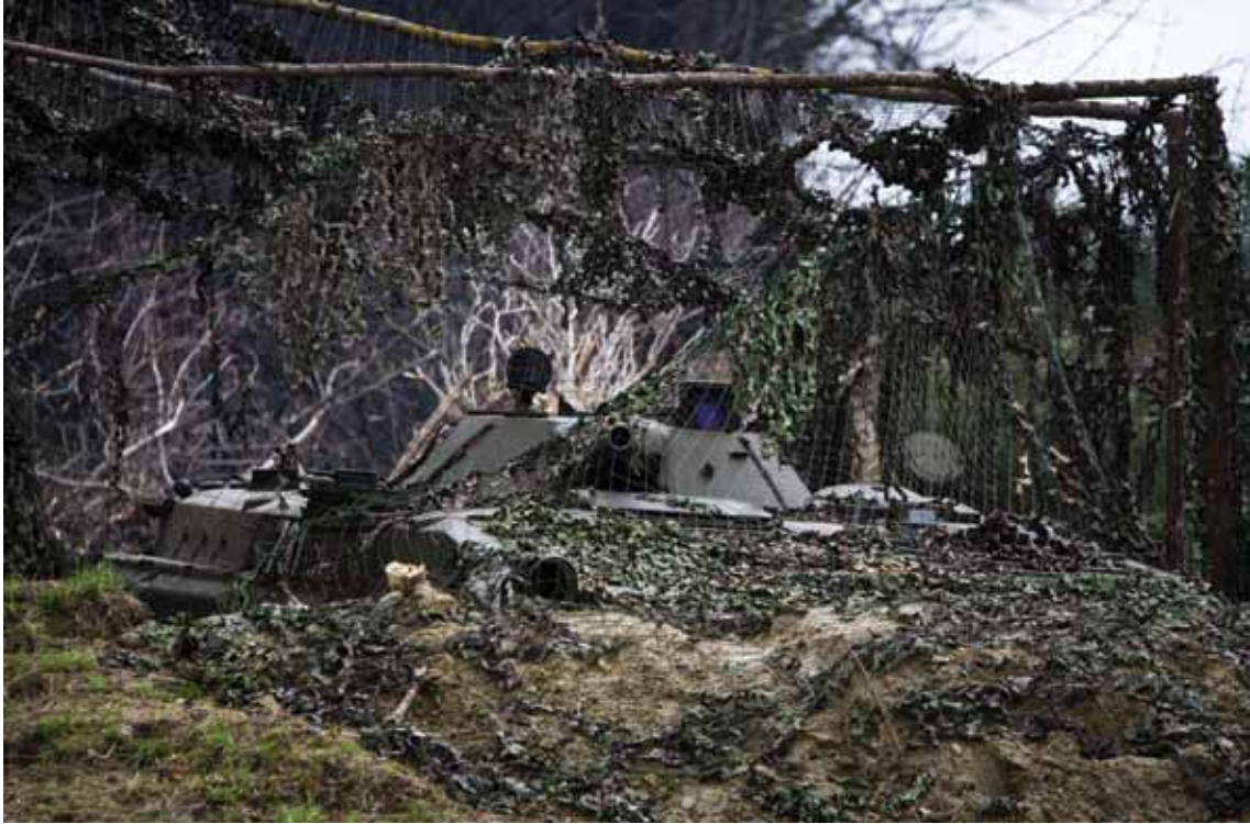
Замаскированная боевая машина пехоты „БМП-1“