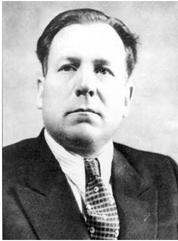
LSSR MGB ministras gen. Piotras Kapralovas