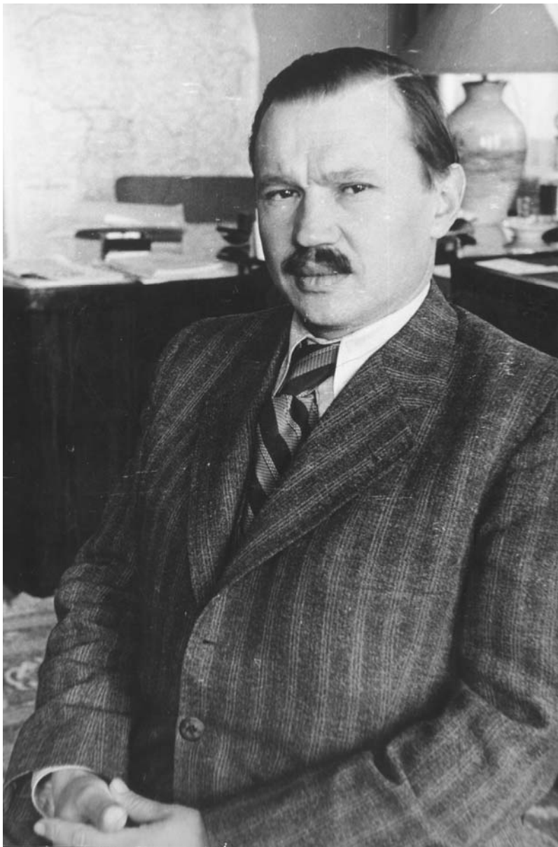
A.Sniečkus darbo kabinetē Kaunē 1941 m.