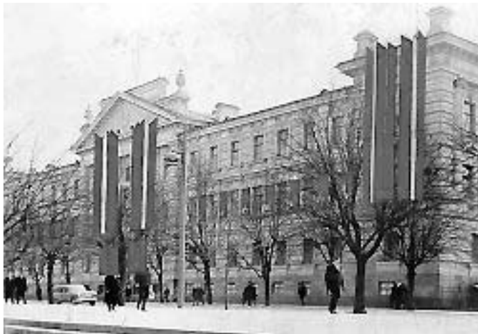
Buvę MGB-KGB rūmai Vilniuje, Gedimino g.