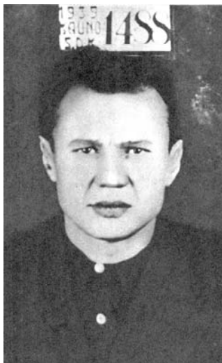
A.Sniečkus po suėmimo. Kaunas 1930 m.