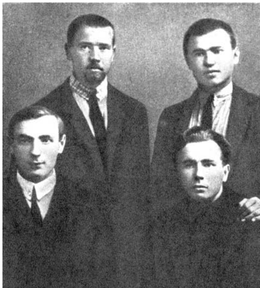
A.Sniečkus su draugais Smolenske 1925 m.