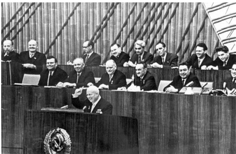
A. Sniečkus SSKP XXII suvažiavimo pradžioje 1961 m. Maskvoje. Tribūnoje N. Chruščiovas