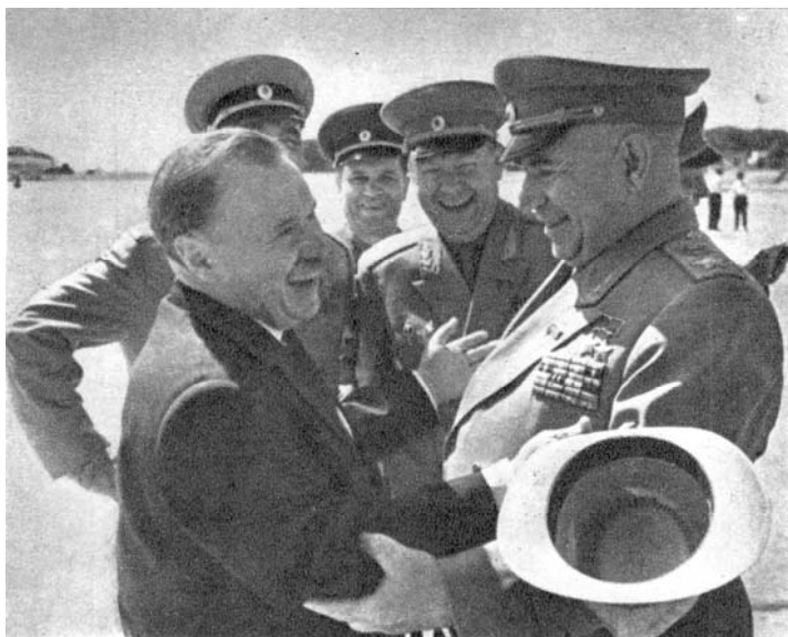
A. Sniečkus su maršalu N. Krylovu ir kitais sovietų kariuomenės aukšto rango kariais. N. Krylovo garbei Vilniaus Minties gatvė buvo pavadinta jo vardu. 1964 m. liepa