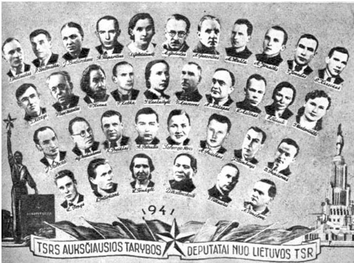
A. Sniečkus SSRS Aukščiausiosios Tarybos deputatas. 1941 m. vasaris