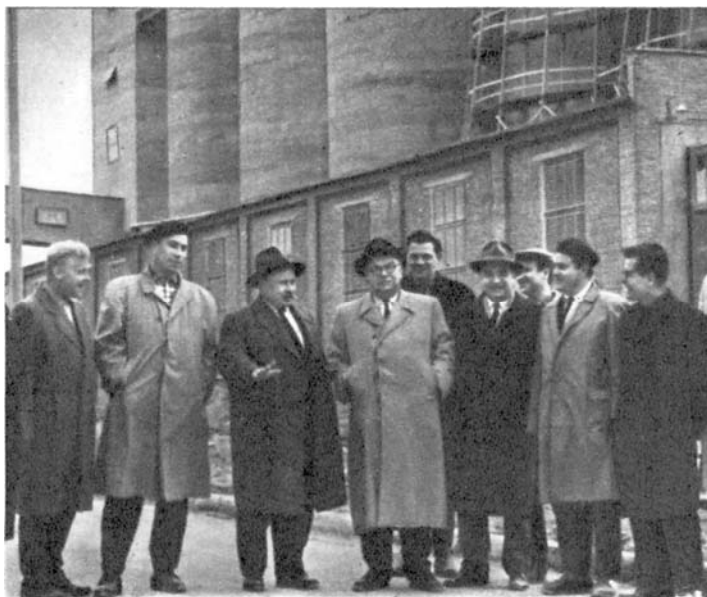
A. Sniečkus su žurnalistais iš Maskvos Kėdainių chemijos kombinate. 1964 m.