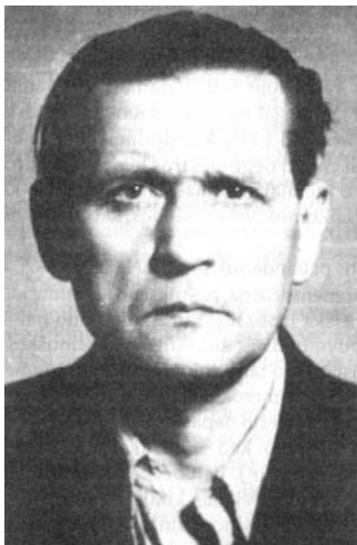
Paskutinė partizanų generolo Jono Žemaičio nuotrauka, daryta KGB (MVD) kalėjime 1953 m.