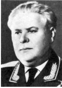
LSSR vidaus reikalų ministras Alfonsas Gailevičius