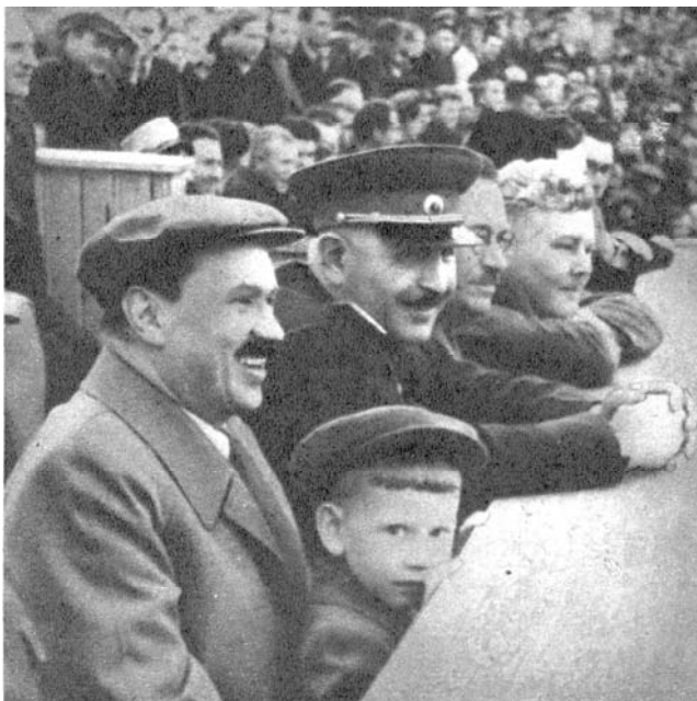
A.Sniečkus, gen. I. Bagramianas, M. Gedvilas respublikinėje dainų šventėje. Vilnius, 1950 m.