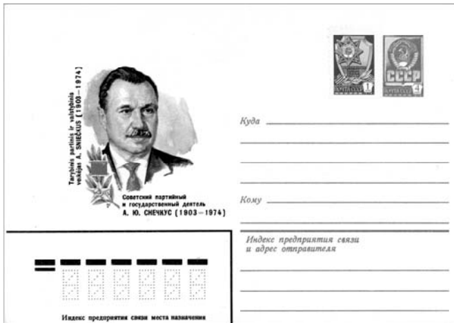
1982 m. Permėje (Rusija) išleistas pašto vokas su A. Sniečkaus atvaizdu. Dailininkas P.Bendelis