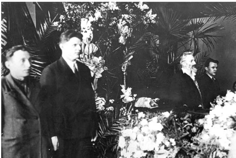
V. Kapsuko laidotuvės Maskvoje 1935 m. Antras iš kairės K. Preikšas, toliau Z. Angarietis, A. Sniečkus