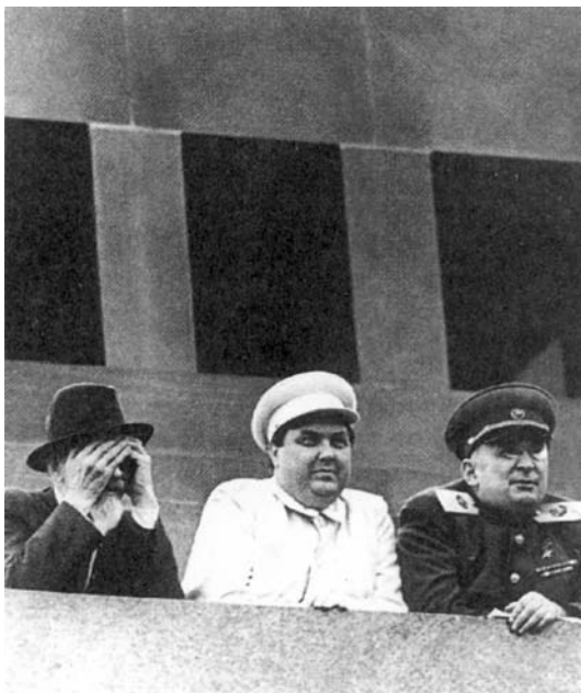
Michailas Kalininas, Georgijus Malenkovas, Lavrentijus Berija, Kremlius