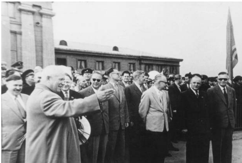
N. Chruščiovas Rygos oro uoste. Kairėje A. Sniečkus. 1959 m. birželio 9 d.