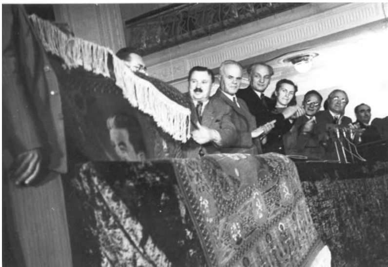
LSSR Aukščiausiosios Tarybos sesija. A. Sniečkus, J. Paleckis ir kiti apžiūri Turkmenijos SSR delegacijos dovanotą kilimą – Stalino portretą. Vilnius, 1950 m. liepos 20 d.