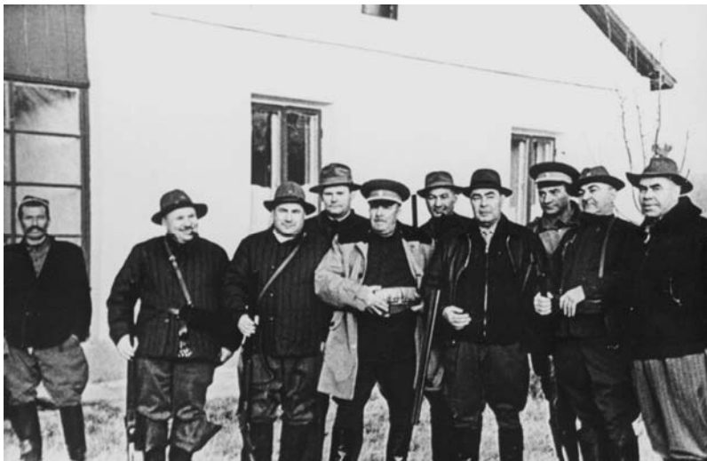
Po perversmo. L. Brežnevas su palyda medžioklėje Uzbekijoje. Antras iš kairės A. Sniečkus. 1964 m. lapkričio mėn.