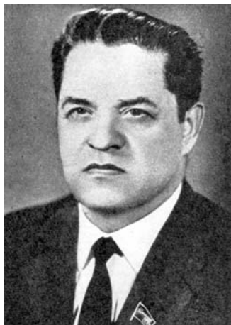
LSSR MT pirmininkas Juozas Maniušis