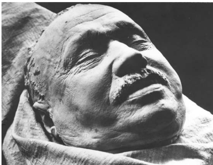
A.Sniečkaus pomirtinė kaukė, padaryta naktį 1974 m. iš sausio 22 į 23 Vilniuje