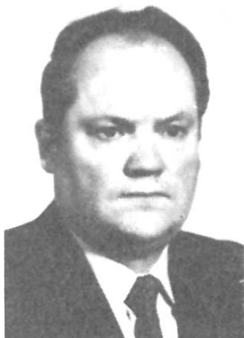
LKP CK sekretorius Ringaudas Songaila