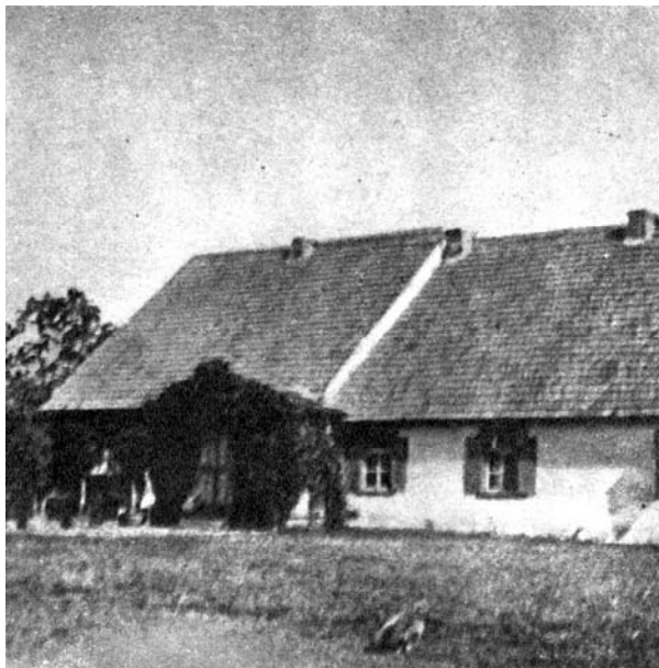
Namas Bubleliuose, kur gimė Antanas Sniečkus