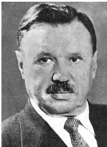
Antanas Sniečkus 7 dešimtmetyje