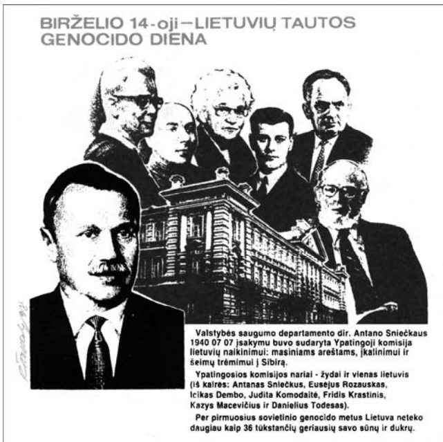
1998 m. savilaidos neoficialus pašto vokas