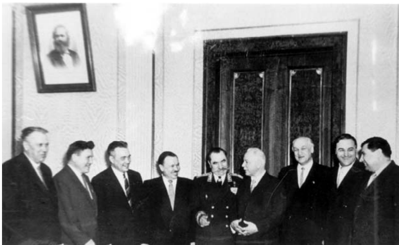
A. Sniečkus, K. Vorošilovas, S. Budionas, J. Paleckis ir kt. Kremlius, 1958 m.