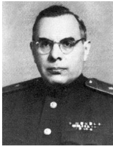
LSSR MGB ministras gen. Piotras Kondakovas