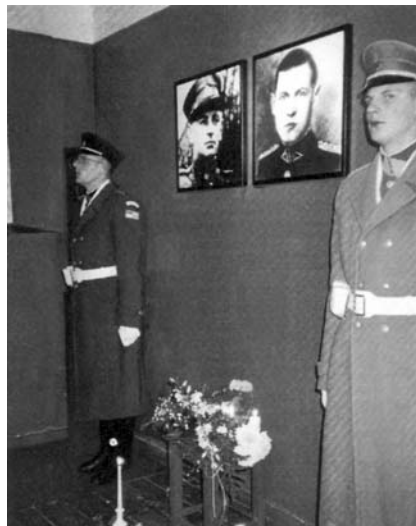
Garbės sargyba buvusio Vilniaus KGB kalėjimo kameroje, kurioje kalėjo gen. Jonas Žemaitis-Vytautas, o vėliau buvo kalinamas gen. Adolfas Ramanauskas-Vanagas