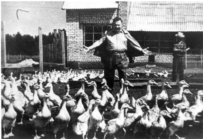
A.Sniečkus Druskininkų tarybiname ūkyje