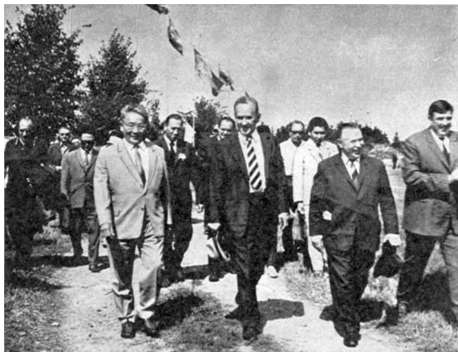
Priekulės hipodrome. Iš kairės: Mongolijos liaudies respublikos vadovas J. Cedenbalas, SSRS MT pirmininkas A. Kosyginas, A. Sniečkus. 1972 m.