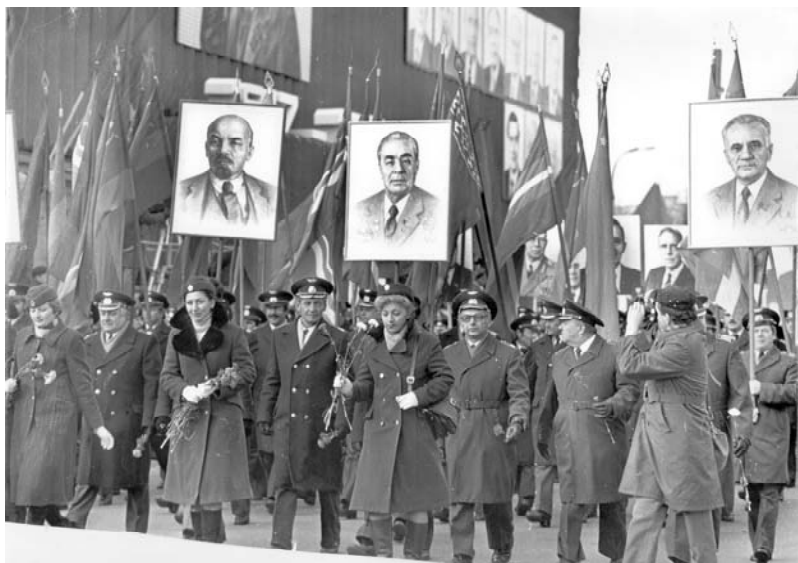
Komunistinė demonstracija Vilniuje. Žygiuoja „Aerofloto“ delegacija