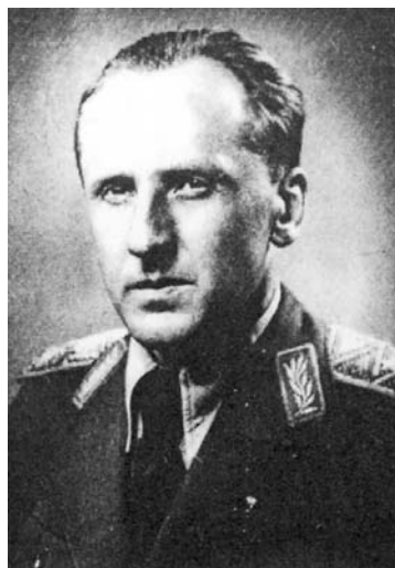
LSSR NKGB komisarai gen. Aleksandras Guzevičius