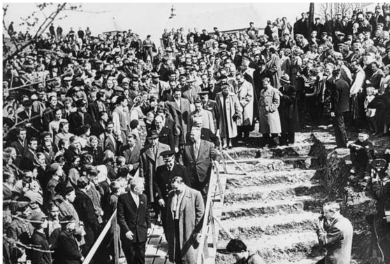
LSSR vadovai Kauno HES statyboje. Priekyje A. Sniečkus. 1959 m. gegužė