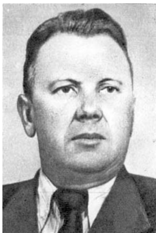
LSSR MT pirmininkas Motiejus Šumauskas