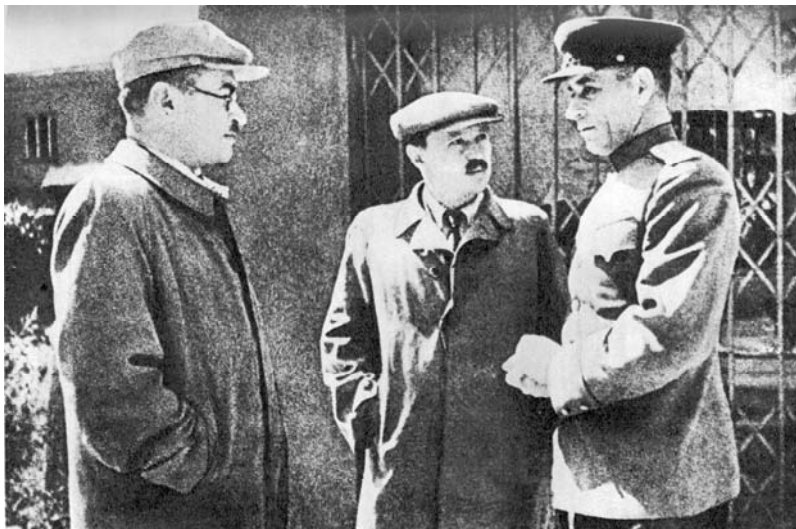
M. Gedvilas ir A. Sniečkus (viduryje) Raudonosios armijos užimtame Kaune 1944 m. rugpjūčio 1 d.