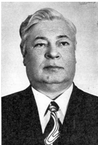
Vilniaus miesto KP komiteto I-asis sekretorius Petras Griškevičius