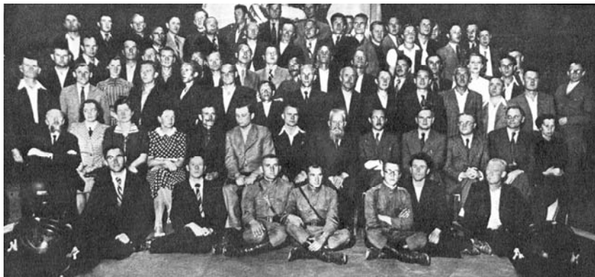
Liaudies Seimo nariai ir pašaliniai. Kaunas, 1940 m. liepa