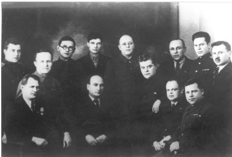
Vokiečių okupuotų respublikų ir sričių sovietinių partizanų štabų vadai. Maskva, 1944 m. Pirmas iš dešinės A. Sniečkus, centre stovi M. Suslovas