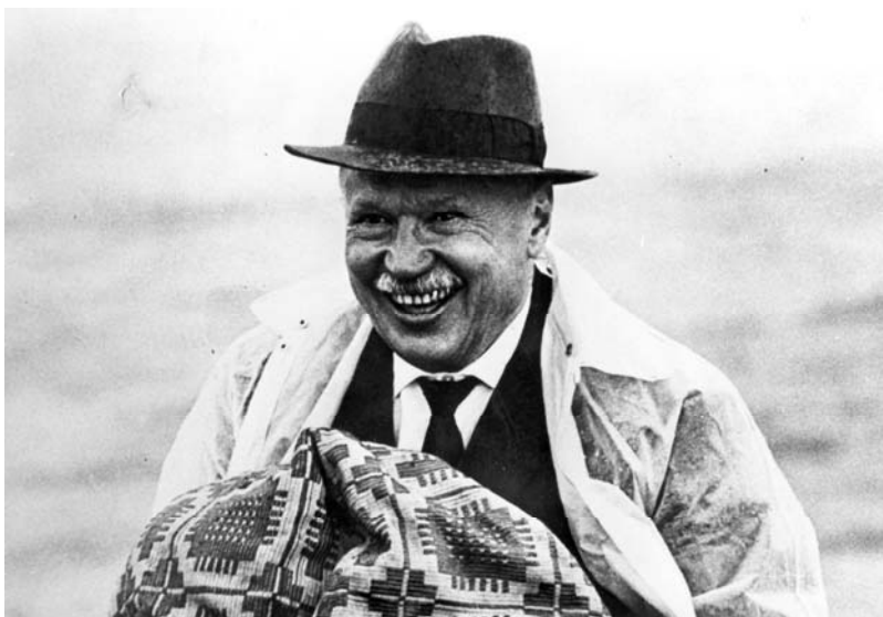
Žūklėje. Viena iš paskutiniųjų A. Sniečkaus fotografijų