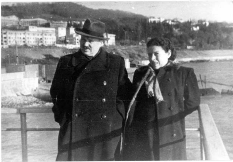
A. Sniečkus su žmona prie Juodosios jūros