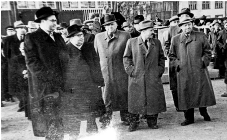
A. Sniečkus ir M. Šumauskas svečiuose pas Estijos KP(b) CK I-ąjį sekretorių Ivaną Kebiną. Apie 1950 m.