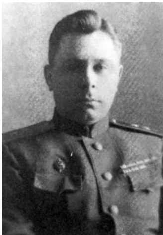
SSRS NKVD-NKGB igaliojinis Lietuvoje gen. Ivanas Tkačenka