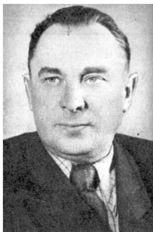
LSSR KGB komiteto pirmininkas Kazimieras Liaudis