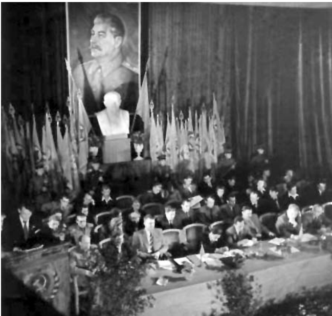
Lietuvos komjaunimo (LLKJS) IV suvažiavimas. Vilnius, 1948 m. liepos 2 d.