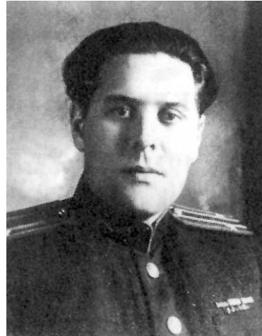
LSSR MGB-MVD ministro pavaduotojas Alfonsas Gailevičius