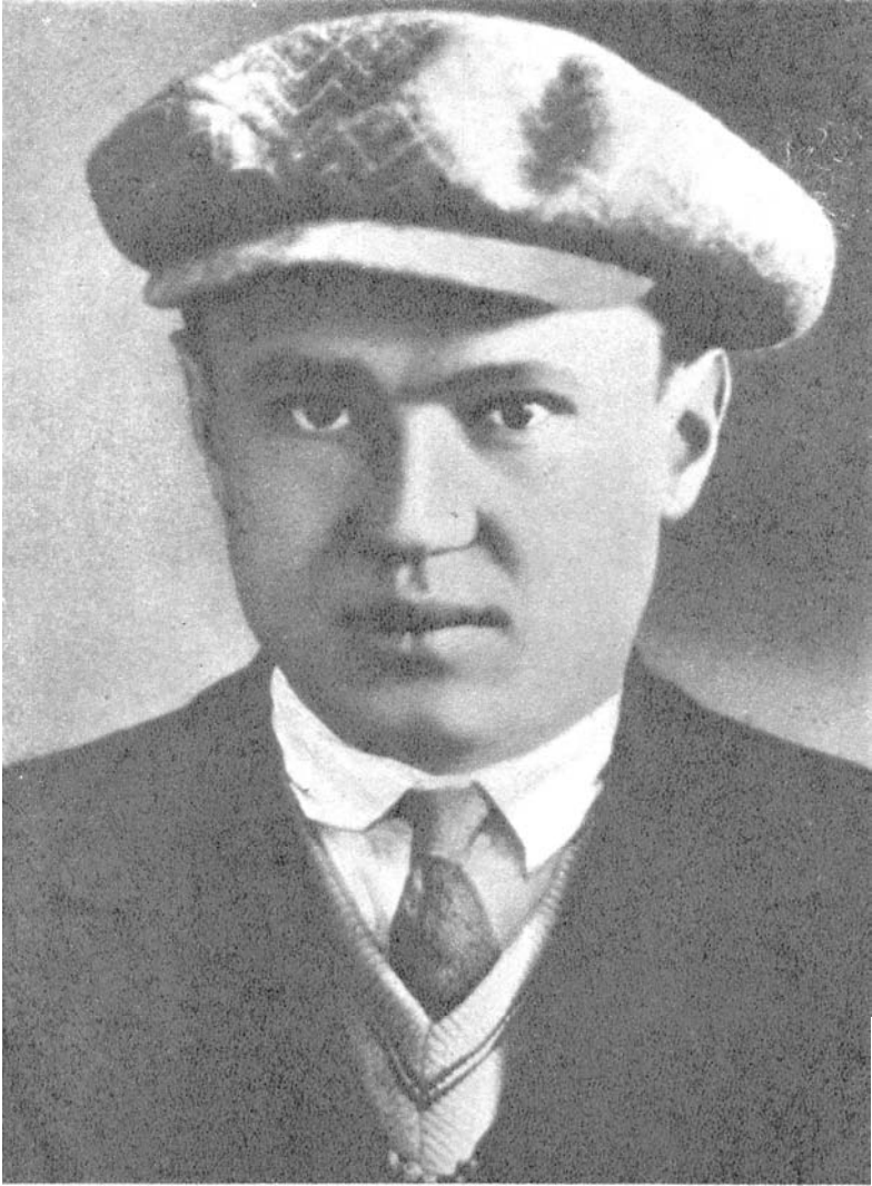
A.Sniečkus Kauno sunkiuju darbu kalėjime. 1939 m.