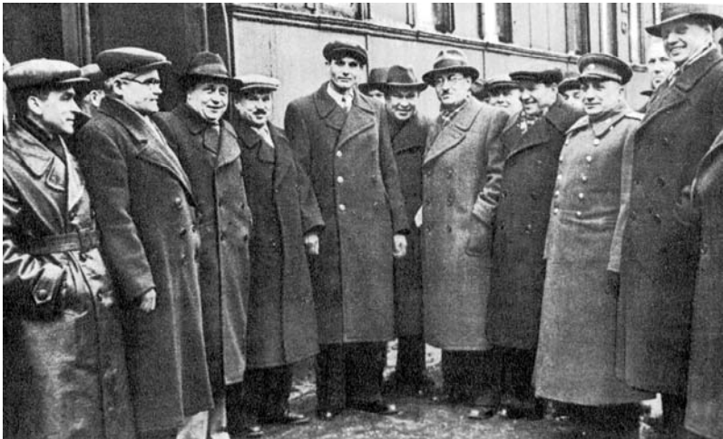
VKP(b) CK Lietuvos biuro pirmininko Michailo Suslovo (1944–1946 m.) išlydėjimas iš Lietuvos. Iš kairės: antras – A. Sniečkus, trečias – M. Suslovas, penktas – M. Gedvilas. Vilnius, 1946 m. kovo mėn.