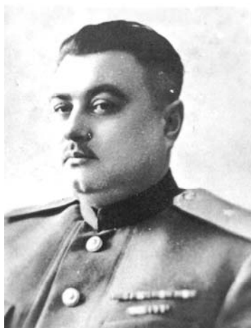
LSSR NKGB-MGB komisarai- ministras gen. Dmitrijus Jefimovas