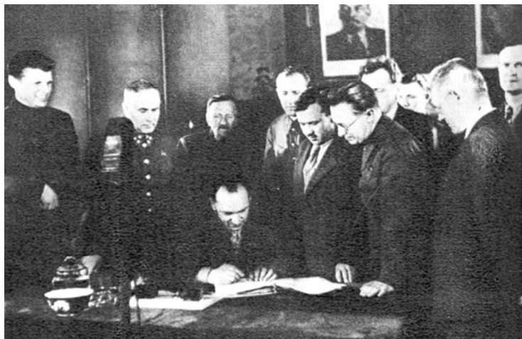
„Lietuvių tautos atstovų“ propagandinio mitingo dalyviai pasirašo kreipimąsi į „Į lietuvių tautą“. Maskva, 1942 m. balandžio 26 d. Iš kairės: K. Preikšas, V. Vitkauskas, L. Gira, J. Paleckis, A. Guzevičius, A. Sniečkus, M. Gedvilas, A. Venclova ir kt.