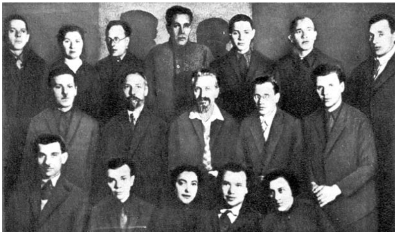
Iškeistieji Lietuvos komunistai Maskvoje kartu su V. Kapsuku ir Z. Angariečiu (centre). A. Sniečkus pirmoje eilėje antras iš dešinės. 1933 m.