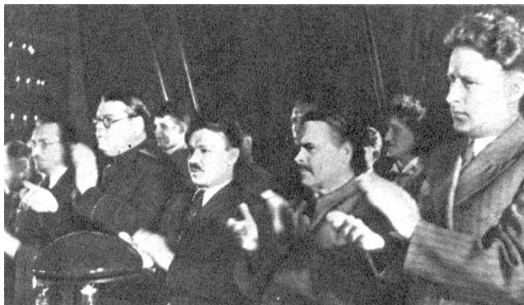
Pabaltijo sovietinių respublikų trečiujų "metinių" minėjimas Maskvoje. 1943 m. liepos 21 d. Iš kairės M. Gedvilas, VKP(b) CK sekretorius A. Ščerbakovas, A. Sniečkus, VKP(b) CK sekretorius A. Andrejevas, Estijos KP(b) CK I-asis sekretorius V. Korotamas