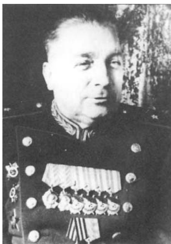
LSSR NKVD-MVD komisarai- ministras gen. Juozas (Josifas) Bartašiūnas