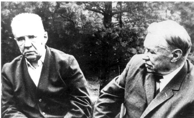
SSRS MT pirmininkas A. Kosyginas ir A. Sniečkus. Palanga, 7-ojo dešimtmečio antroji pusė