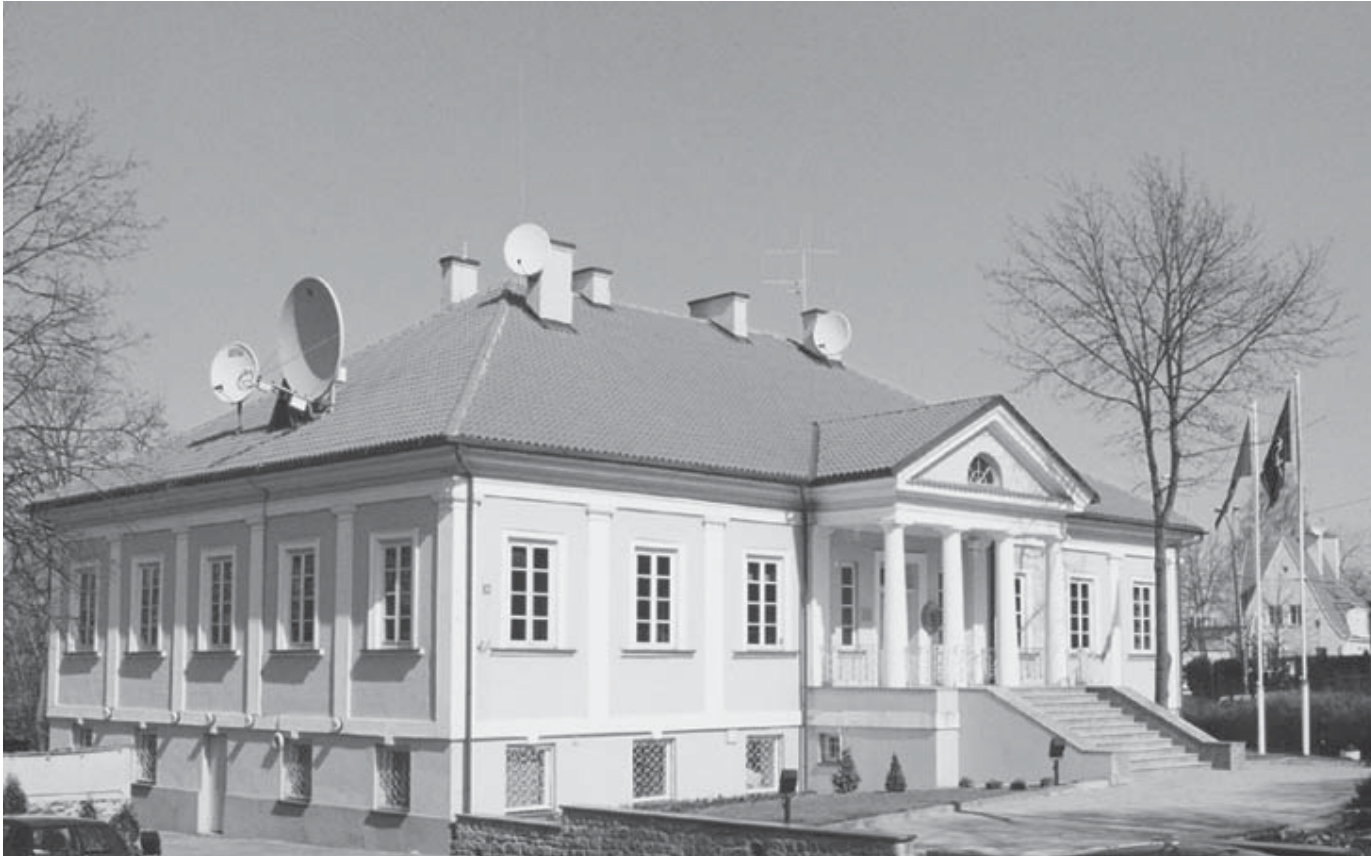
Krašto apsaugos departamento pastatas T. Kosčiuškos g. 36 Vilniuje