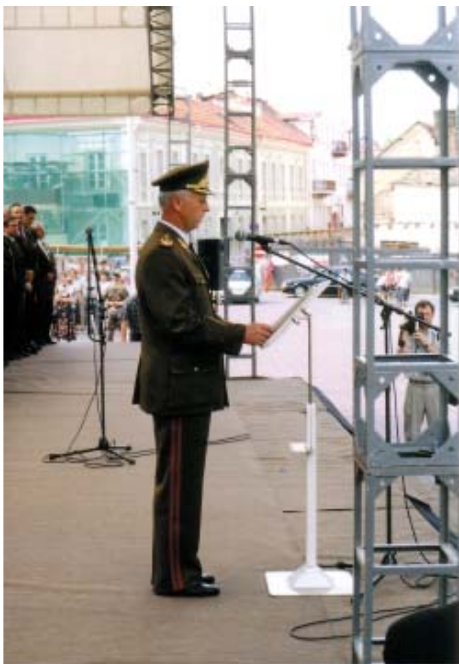
Kariuomenės vado atsisveikinimo kalba. 1999 liepos 1 d.