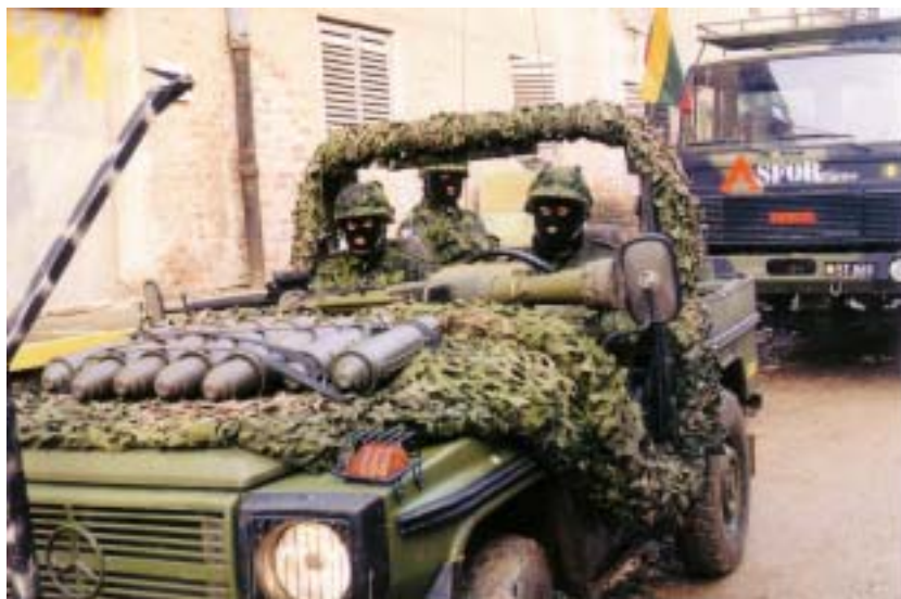
Lietuvos kariai tarptautinėje misijoje

vauti tarptautinėse operacijose ir, kas buvo labai vertinama mūsų akylų oponentų ir kritikų Vakaruose, susitarimas šalies gynybai skirti ne mažiau kaip 2 proc. bendrojo vidaus produkto. Šis susitarimas vėliau, 2004 m., buvo pratęstas dar ketverių metų laikotarpiui – iki 2008 m. Dar vienas konsensuso kūrimo pavyzdys – 2002 metais visuotiniu sutarimu Seime patvirtinta Nacionalinio saugumo strategija. Taigi žingsnis po žingsnio buvo kuriami pamatai ir, kas ne mažiau svarbu, atliekami praktiniai darbai. Nuo 1994 m. Lietuva praktiškai pasinaudojo visomis jai suteiktomis praktinio bendradarbiavimo su NATO galimybėmis. Viena pirmųjų (formaliai antra po Rumunijos) pasirašė vadinamąjį partnerystės taikos labui pagrindų dokumentą, viena pirmųjų atidarė NATO būstinėje ryšių su NATO biurą, o 1997 m. lapkričio 12 dieną kartu su pirma grupe įsteigė misiją prie NATO – savarankiškai veikiančią diplomatinę atstovybę. Vėlgį 1994 m., pasinaudodama glaudžiais ryšiais su Danijos gynybos ministerija, Lietuva pirmoji iš Baltijos valstybių pradėjo dalyvauti tarptautinėse misijose. Tam reikėjo sukurti teisinę bazę. Buvo daug skepticizmo ir atviro pasipriešinimo Seime. Nebuvo jokios patirties. Įstatymas, apibrėžiantis Lietuvos karių buvimo užsienyje sąlygas, buvo priimtas labai sudėtingomis aplinkybėmis. Ne visi tuo metu Lietuvoje suprato, kad mes