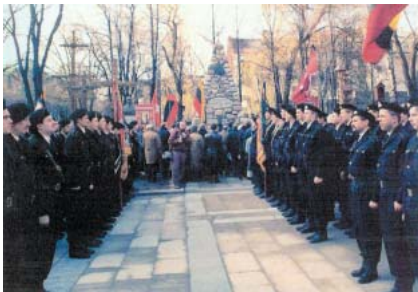
1990 m. lapkričio 23 d. Nežinomojo kareivio perlaidojimas Kaune, Vytauto Didžiojo karo muziejaus kiemyje

1991-ieji metai. Prisiminkime sausio–rugpjūčio mėnesių įvykius. Tie metai buvo ypač svarbūs šaliai. Sausio pradžioje Apsaugos kuopos kariai tapo Parlamento gynėjais. Vilkėjome pirmąsias juodas uniformas, praktiškai buvome beginkliai, bet ryžto ir valios turėjome daug.