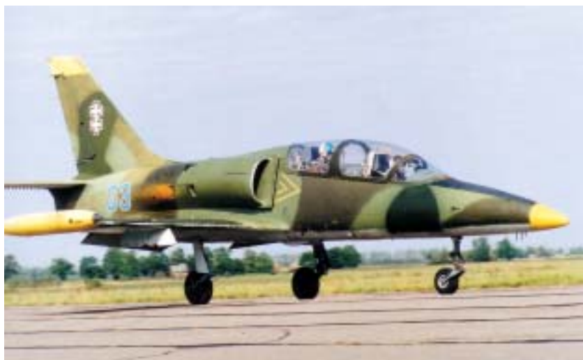
Lietuvos kariuomenės mokomasis naikintuvas „Albatros“

Daugiausia dėmesio buvo skiriama sausumos pajėgų batalionų kovinio pajėgumo didinimui – jų struktūros tobulinimui, paramos elementams, personalo koviniam parengimui, apginklavimui ir aprūpinimui. Vystant gynybos struktūrą, buvo įsteigta Oro erdvės stebėjimo ir kontrolės valdyba su komandiniu centru Karmėlavoje, naujai įrengtos arba rekonstruotos radarų stotys Juodkrantėje, Degučiuose, Vištytyje ir Ignalinoje. Kooperuojant lėšas ir pa-