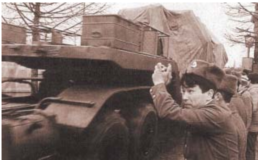
Jie jau nebesugrįš