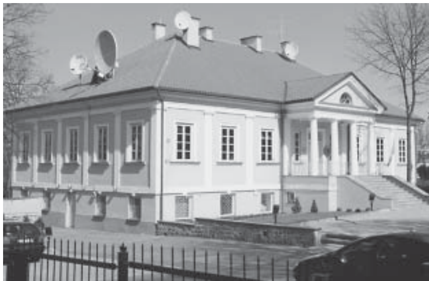
Pirmasis KAD pastatas Kosciuškos g. 36

Gegužės mėnesį departamentui skiriamos patalpos Kosciuškos g. 36, kur šiuo metu yra Danijos ambasada. Pradėta formuoti departamento struktūra,