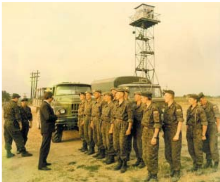
Krašto apsaugos ministras A. Butkevičius duoda paskutinius nurodymus prieš perimant Lietuvos–Lenkijos sienos apsaugą 1992 m.

vyksta ir KAD generalinis direktorius Audrius Butkevičius. Tomis dienomis iš sovietų pasieniečių, nuo Vištyčio iki Kauknorio užkardų, buvo perimta Lietuvos–Lenkijos valstybinė sienos apsauga. „Geležinio Vilko“ brigados kariai taip pat aktyviai dalyvavo išvedant iš Lietuvos sovietinę kariuomenę ir perimant jos paliekamas teritorijas bei pastatus.