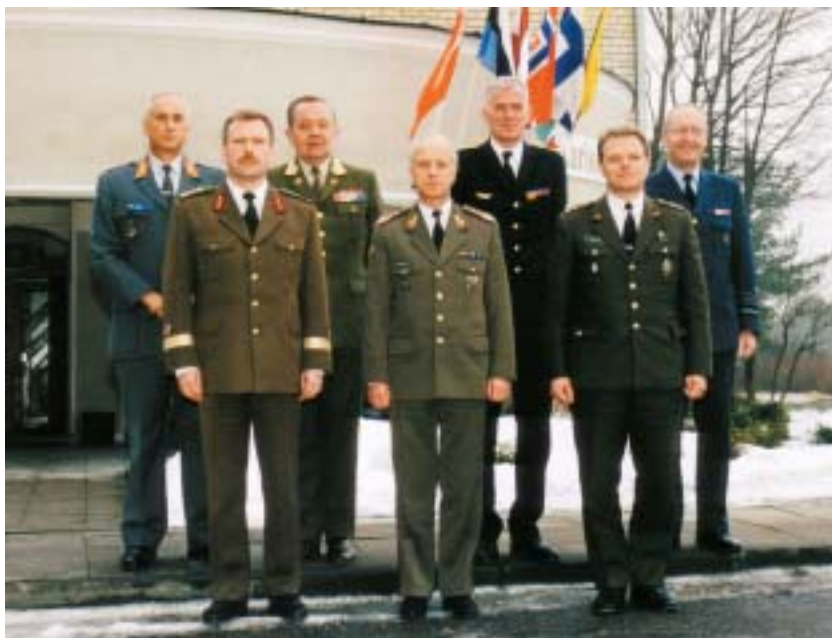
Septynių Baltijos valstybių kariuomenių vadų susitikimas Druskininkuose. 1998 m.

užduotys. Pirmieji iš užsienio šalių atvykę dirbti buvę kariškiai ėmėsi mokyti vakarietišku procedūrų, teorijos ir praktikos. Jų žinios ir praktika labai praverė Lietuvai integruojantis į NATO ir Europos Sąjungą.