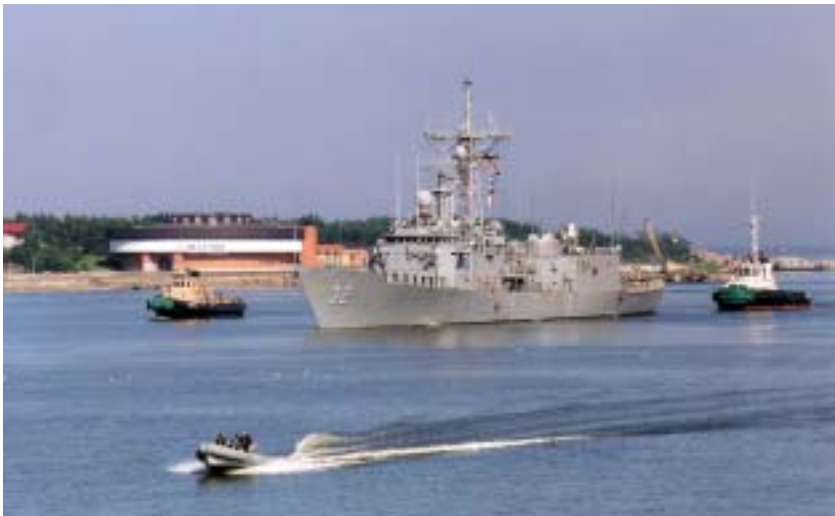
NATO karo laivai Klaipėdoje. 2001 m. liepos 6 d.