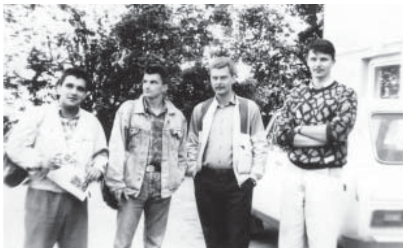
Karinio-techninio sporto klubo nariai

vos teritorijoje tada dar buvo daug svetimų kariuomenės. Bet nenumaldomo laisvės troškimo ir prieškarinio kovų dvasios įkvėpti norėjome kuo greičiau