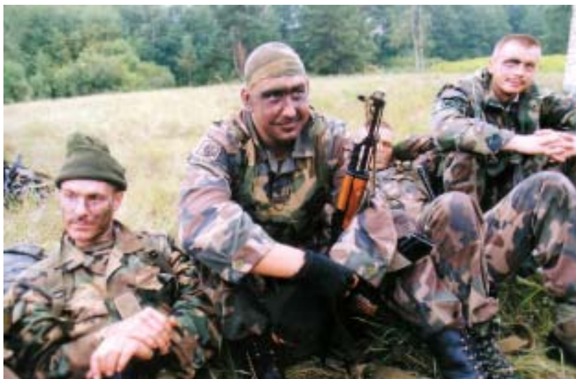
Poilsio minutė pratybų metu

Kariuomenės pasirengimo sėkmę lėmė ne vien 1998 m. smarkiai padidėjęs finansavimas, bet ir pasirinkti prioritetai bei efektyvus finansinių ir kitokių išteklių panaudojimas. 1998 m. buvo parengtas 10 metų ilgalaikis planas, kurį Lietuvoje patvirtino Valstybės gynimo taryba ir gerai įvertino NATO vadovybė. Tame plane buvo numatytos pagrindinės Lietuvos kariuomenės reformos kryptys: kaip profesionaliai, pagal Vakarų šalių metodiką, parengti karius, sukurti šiuolaikinius reikalavimus atitinkančią infrastruktūrą ir įsigyti atitinkamą ginkluotę. Visa veikla buvo grindžiama Lietuvos ekonomikos plėtros prognozėmis ir turėjo būti vykdoma etapais. Karių koviniam parengimui ir visapusiškam jų aprūpinimui buvo skiriama pirmenybė.