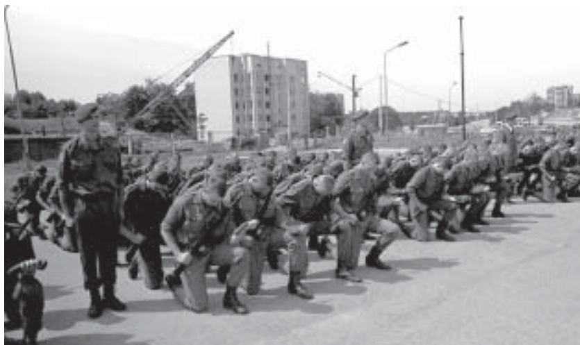
Prisiekia „Geležinio Vilko“ kariai

kariuomenė yra pajėgesnė, funkcionalesnė, aprūpinta ginkluote bei technika. Tokią kariuomenę kūrėme penkiolika metų, su tokia ir atėjome į NATO. Kas pasikeitė ir kas keičiasi?