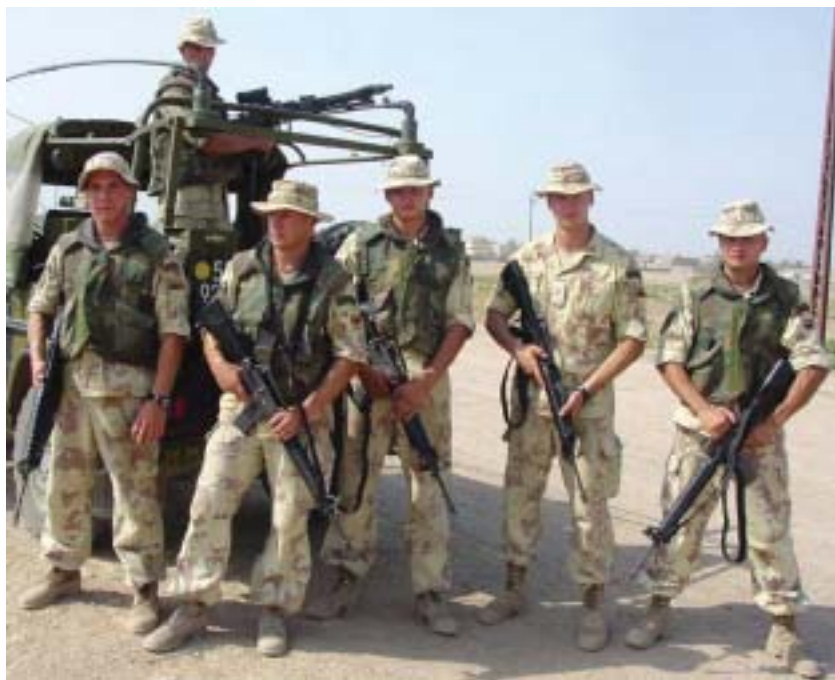
Lietuviai kariai Irake

Sugrįžkime prie transformacijos, prie to, kaip Lietuvos krašto apsaugos sistema reaguoja į naujai iškilusias grėsmes. Apie sėkmingą Lietuvos karių dalyvavimą tarptautinėse misijose pasakyta šimtai kalbų, parašyta tūkstančiai pranešimų. Lietuvos, kaip patikimos misijų dalyvės, reputacija bei Lietuvos diplomatinės iniciatyvos atnešė ir naujų iššūkių. Tarp jau šiųmetinių – Lietuvos vadovaujama provincijos atkūrimo grupė Afganistano Goro provincijoje, planuojamas karinio kontingento didinimas Kosove ir vadovaujančio vaidmens prisiėmimas batalione LITPOLUKRBAT (kuris rasis iš dabartinio POLUKRBAT). Tuo pat metu planuojamas tolesnis dalyvavimas taikos užtikrinimo misijoje Irake – ir 2006 metais.