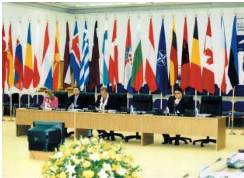
Mes – NATO nariai

vertė NATO narė, aktyviai dalyvauja įgyvendinant NATO politiką. Mūsų konsultacijos perteikiant integracinę patirtį naujosioms partnerėms – Pietų Kaukazo valstybėms, Ukrainai, Moldovai aukštai vertinamos ne tik minėtose šalyse, bet ir pačios NATO vadovybės. Suprasdami, ką reiškia kolektyvinė veikla tiek politiniu, tiek praktiniu požiūriu, mes jau šiandieną darome konstruktyvią įtaką NATO ir ES dialogui. Nuosekliai siekiame, kad šios organizacijos veiktų išvien, vengtų nereikalingo dubliavimo ir lenktyniavimo, kad būtų ir toliau palaikomi glaudūs transatlantiniai ryšiai.