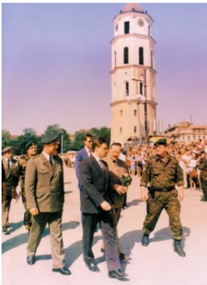
„Geležinio Vilko“ brigados vardo suteikimo iškilmės. 1992 m. birželio 6 d.

Nors šiandien tai atrodo datos, sausi teiginiai, bet tomis dienomis tai buvo labai sunkus, kartais dramatiškas gyvenimas ir pavojingas darbas. Garbė tiems, kurie šį darbą padarė, kurie paklojo pamatus naujai Lietuvos kariuomenei, dabar gebančiai atlikti sudėtingas operacijas Irake, Afganistane, galinčiai būti ne tik saugumo vartotoja, bet ir jos kūrėja.