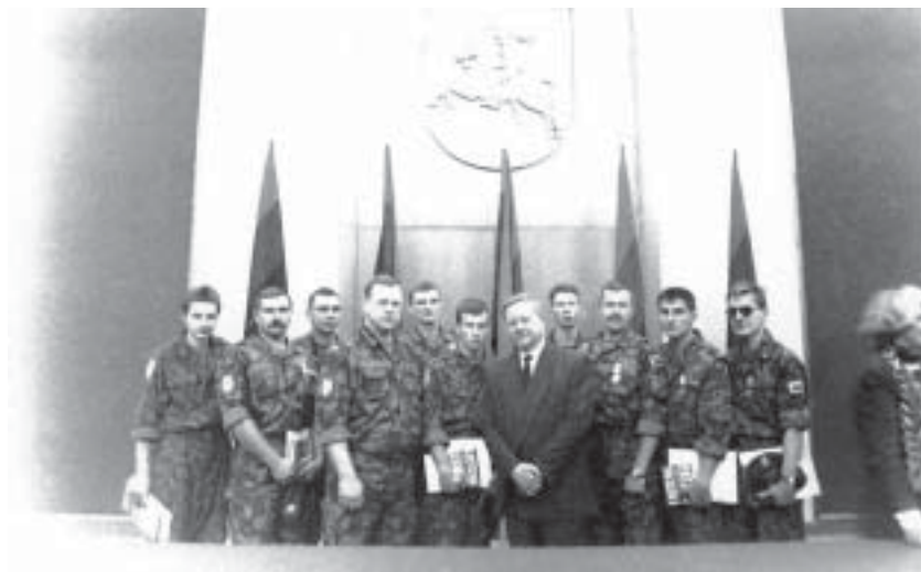
Grupė apdovanotųjų. Centre Aukščiausiosios Tarybos – Atkuriamojo Seimo pirmininkas Vytautas Landsbergis

Atėjo 1992-ieji. Sausio 13-ąją, minint prieš metus vykusius tragiškus įvykius, už drąsą ir pasiaukojimą ginant Lietuvos Respublikos nepriklausomybę sausio–rugpjūčio mėnesiais, grupė brigados karių, savanorių ir pasieniečių buvo apdovanoti valstybiniais apdovanojimais. Apdovanojimus įteikė tuometinis Lietuvos Respublikos Seimo pirmininkas Vytautas Landsbergis.