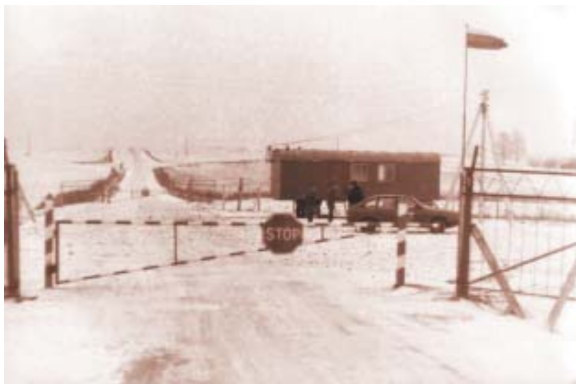
Varėnos užkardos Stražių postas

1990–1991 m. buvo sudėtinga operatyviai valdyti tarnybą, išsibarsčiusią po visą šalies teritoriją. Nurodymai daugiausia buvo žodžiu. To reikalavo ir konspiracija, negarantuota dokumentų apsauga. Dažnai departamento raštiški įsakymai žodžiu buvo koreguojami, atšaukiami. Telefonais naudojomės ribotai, nes žinojome, kad sovietai klausosi mūsų pokalbių.