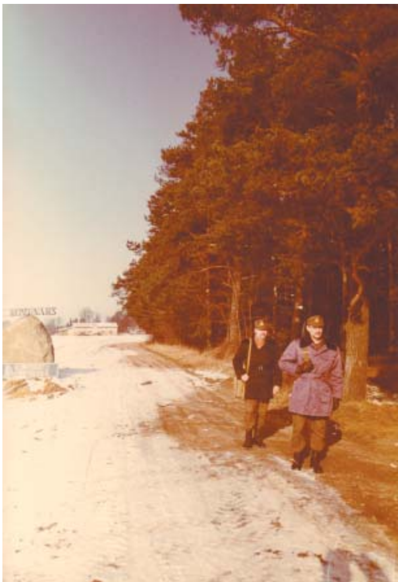
Lietuvos–Latvijos siena. Patrulinė tarnyba