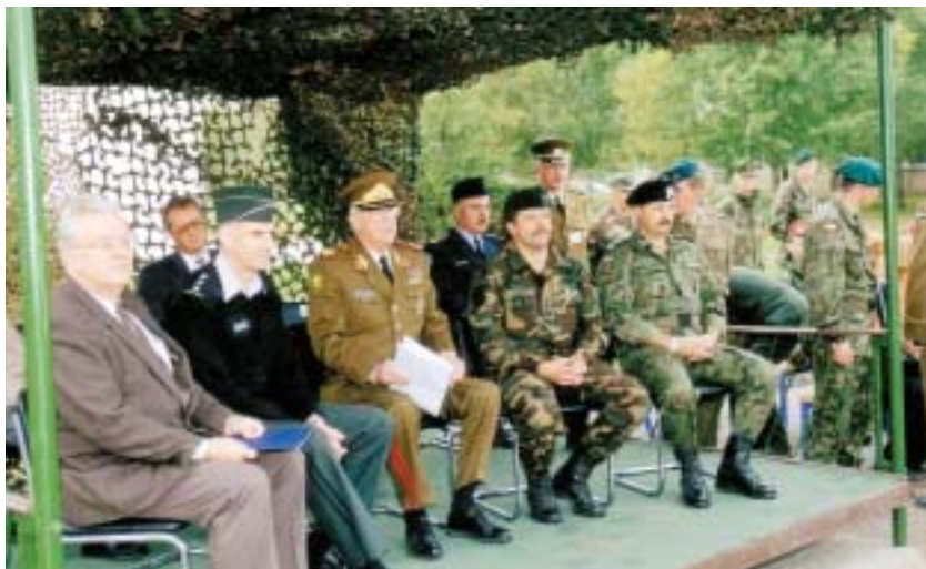
Tarptautinių pratybų „Gintarinė viltis 99“ uždarymas Rukloje. 1999 rugsėjo 21 d.

mums tapus visateise NATO nare, 2004 m. gegužės 6 dieną NATO generalinis sekretorius pareiškė: „Kad galėtume apsiginti, turime ne tik stiprinti teritorinę gynybą – kuri lieka pagrindinė užduotis, – bet ir, Šiaurės Atlanto bendradarbiavimo tarybos žodžiais, turime būti pasiruošę vykti ten, kur kyla grėsmės.“