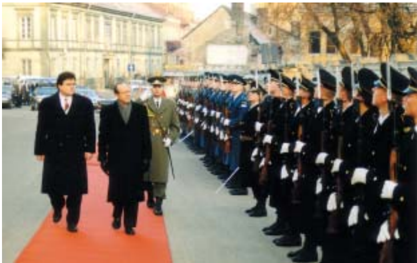
JAV gynybos sekretoriaus W. Prerry vizitas į Lietuvą. 1995 m. lapkričio 21 d.

sprendimu, lėmusiu tokią palyginti greitą ir efektyvią Lietuvos saugumo politikos įgyvendinimo raidą. Šis politinis sutarimas buvo išreikštas 1994 m. sausio 4 d. Lietuvos prezidento A. Brazausko laiške NATO generaliniam sekretoriui M. Vernerui – Lietuva pareiškė sieksianti tapti NATO nare. Įdomu pažymėti, kad tokių laiškų ar pareiškimų dėl stojimo į NATO prašymai nėra taikomi NATO praktikoje, bet to mūsų šaliai reikėjo tiek vidaus, tiek išoriniu požiūriu – kad pademonstruotume sau ir visiems, jog mūsų siekis atspindi visos tautos lūkesčius ir Lietuva tai laiko savo užsienio politikos prioritetu. Tai buvo pirmas akmuo į sutarimo, konsensuso kūrimo pamatus. Dabar tai pateikiama kaip pavyzdys kitoms šalims. Kitas konsensuso kūrimo žingsnis buvo 1996 metais Seime visuotiniu sutarimu priimtas Nacionalinio saugumo pagrindų įstatymas. Jame buvo pabrėžta integracijos į NATO, demokratinės ginkluotųjų pajėgų kontrolės principų taikymo svarba. Žvelgiant iš šių dienų pozicijų tas įstatymas atrodo kiek keistokai – lyg koks nacionalinio saugumo strategijos ir konkrečių tą strategiją įgyvendinančių įstatymų mišinys, bet tai buvo sutarimu pagrįstas kolektyvinis bandymas tęsti tą 1994 m. pareiškta bendrą valią. Toliau būtų galima paminėti partijų susitarimą dėl gynybos 2001–2004 m. Vėlgi akivaizdus pavyzdys, demonstruojantis visų Lietuvos politinių jėgų bendrą valią įgyvendinti gynybos reformą, siekti NATO standartų, daly-