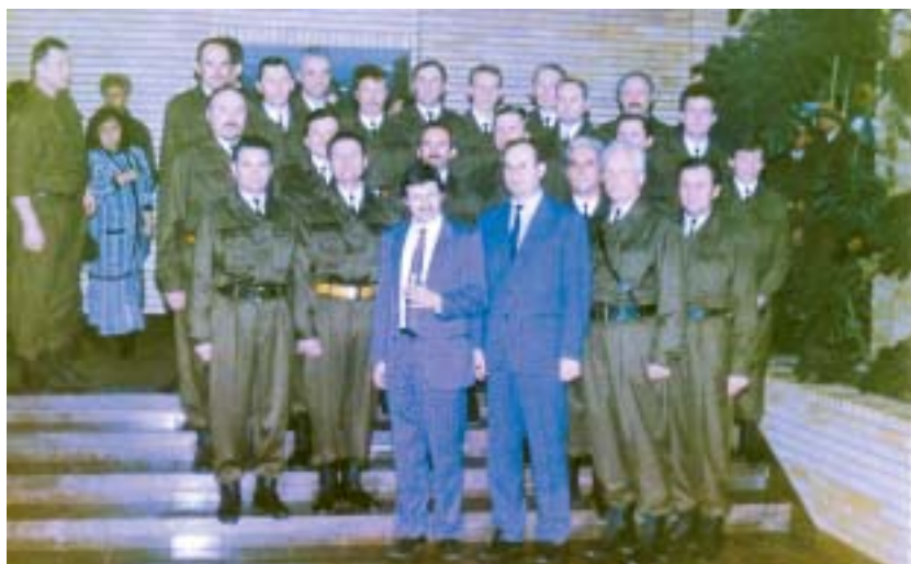
Ministras pirmininkas Gediminas Vagnorius ir krašto apsaugos ministras su grupe karininkų, kuriems suteikti kariniai laipsniai

Metų pabaigoje suteikiami pirmieji karininkų laipsniai.