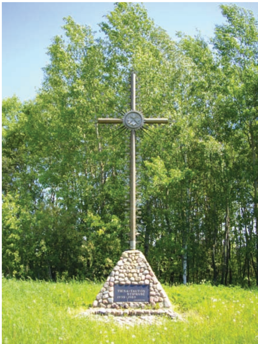
Metalo vamzdžių kryžius: „Tiesa – tautos stiprybė 1939–1989. Kėdainiečiai“. 84 km