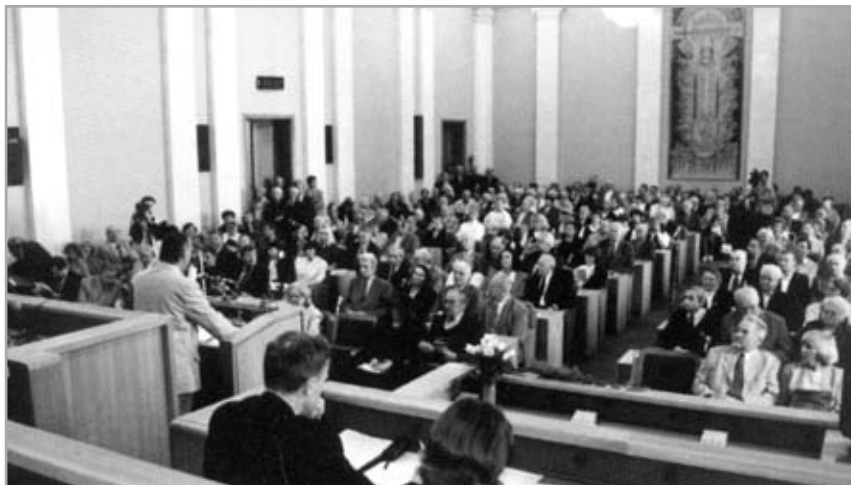
Lietuvos sąjūdžio konferencija, skirta Baltijos kelio 10-mečiui. Vilniaus savivaldybės salė, 1999 m.