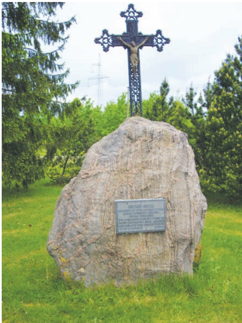
Paminklinis akmuo su kryžiumi. Įrašas lentelėje: „Baltijos kelyje milijonai Lietuvos, Latvijos, Estijos žmonių susijungė rankomis... 1989 08 23–1989 09 28“. Pasvalys