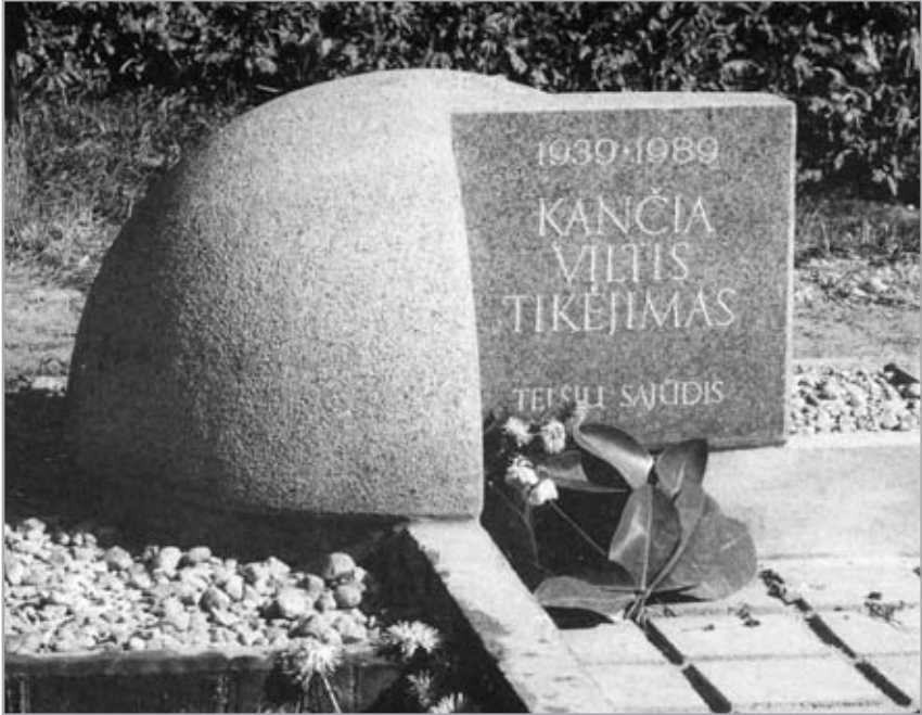
Telšių Sąjūdžio akmuo