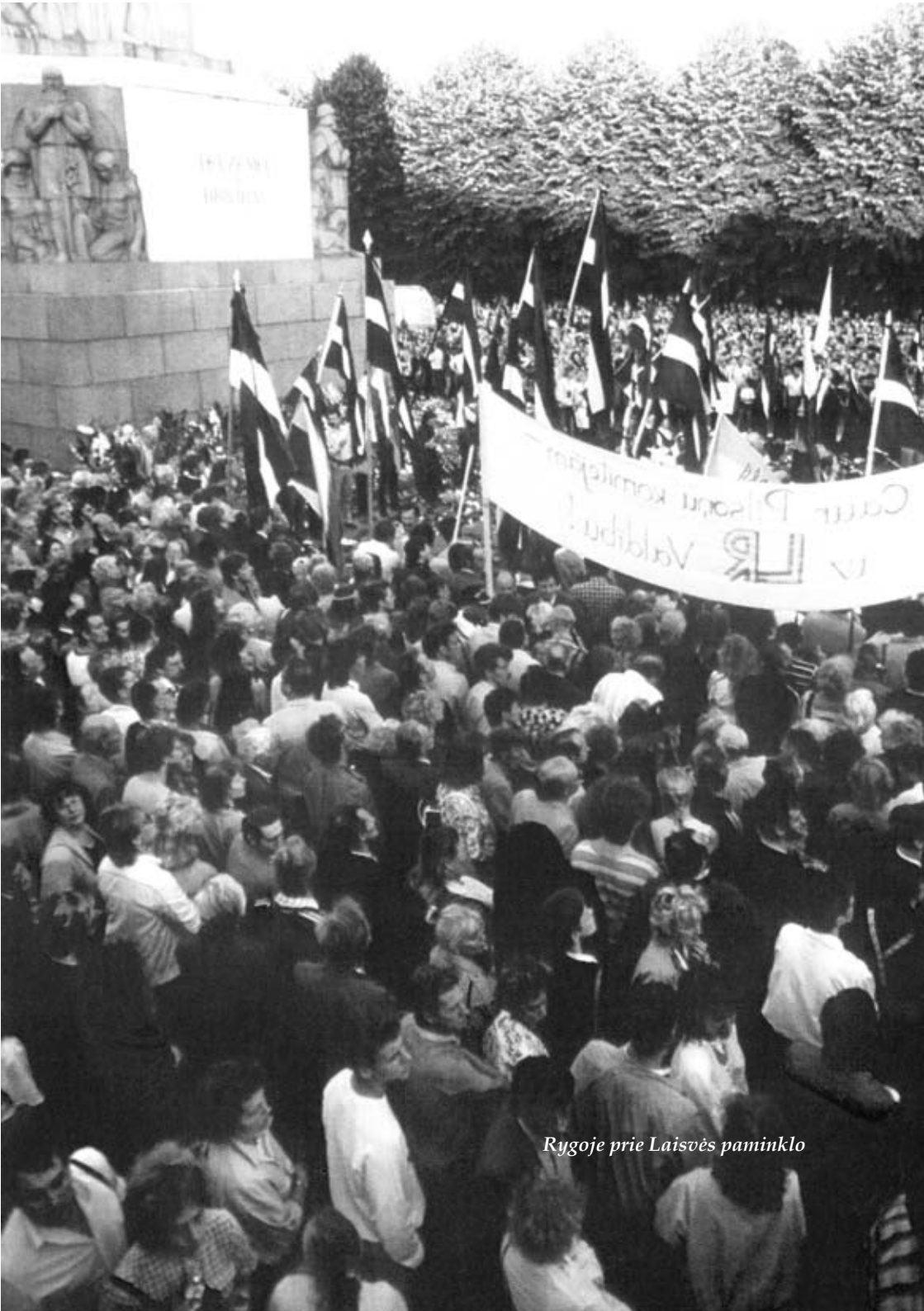
Rygoje prie Laisvės paminklo