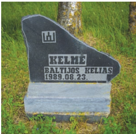
Šlifuotas paminklinis akmuo su Gedimino stulpais: „Kelmė. Baltijos kelias. 1989 08 23“. Talačkoniai