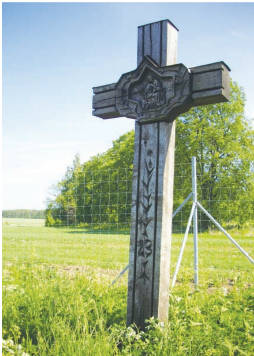
Švenčionių sąjūdininkų kryžius, sukurtas liaudies menininko J. Jakšto. 61 km