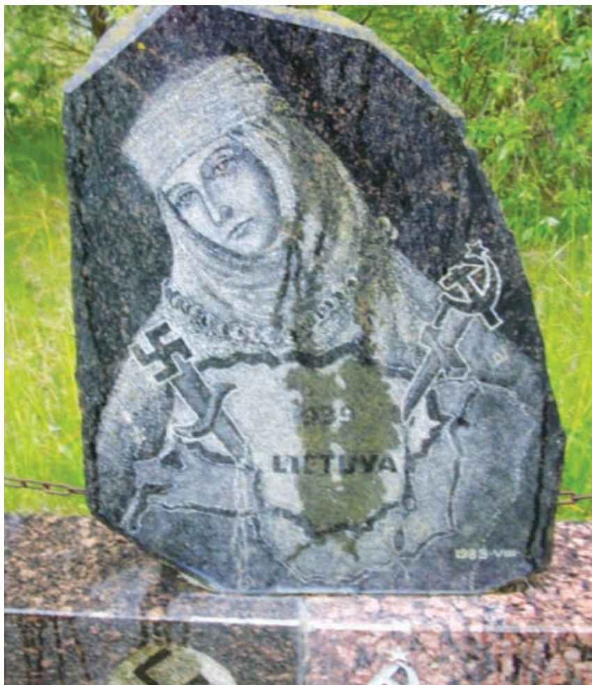
Šiauriečių statytas paminklėlis Sereikonų kaime Pasvalio rajone