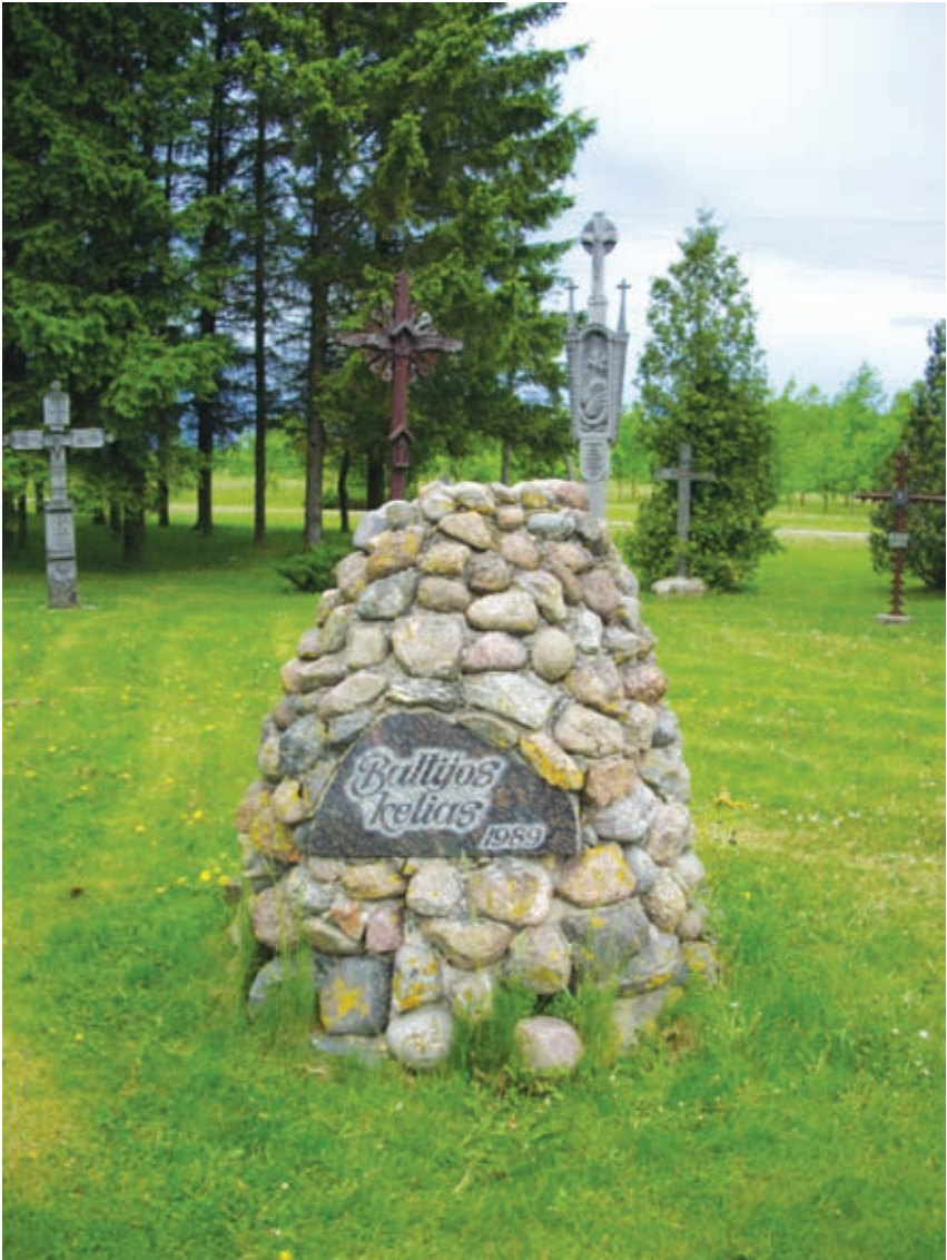
Aukuras iš lauko akmenų: „Baltijos kelias 1989“