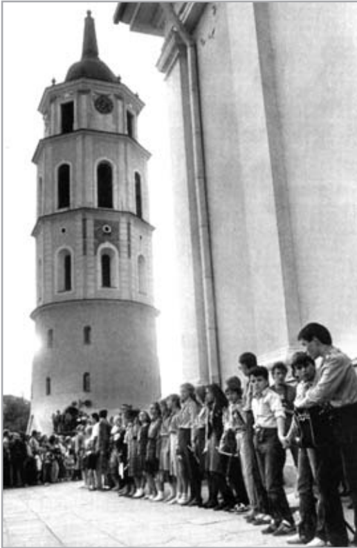
Žmonių grandinė Katedros aikštėje