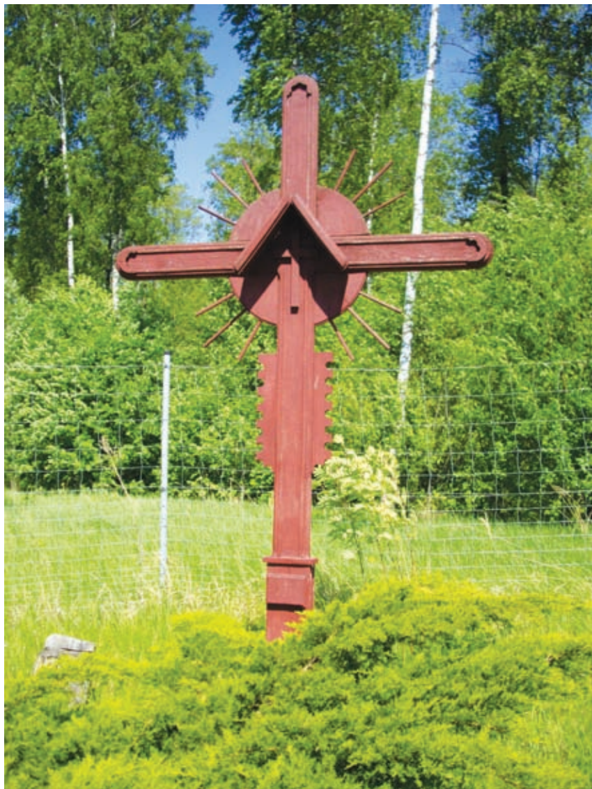
Medinis kryžius. 115 km