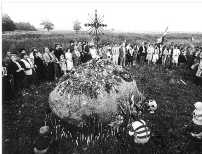
Akimirkos Baltijos kelyje