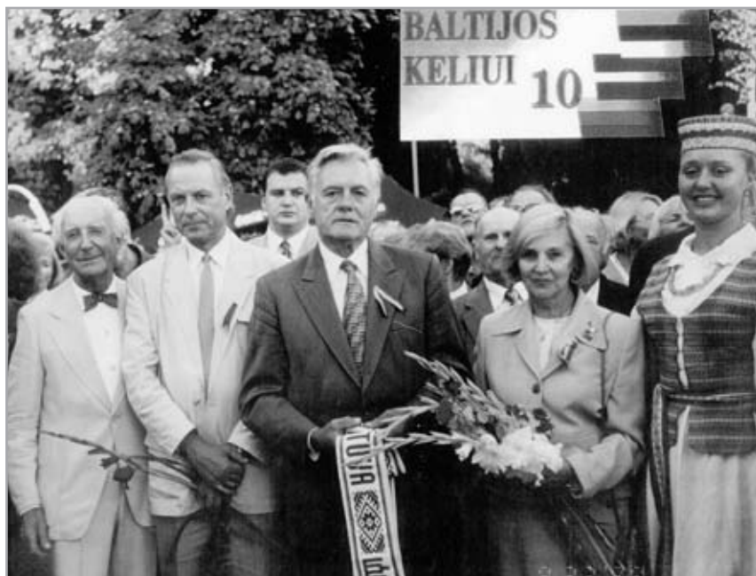
Baltijos kelio 10-metis. Vilniaus Žemutinėje pilyje. Lietuvos Respublikos Prezidentas Valdas Adamkus su žmona Alma