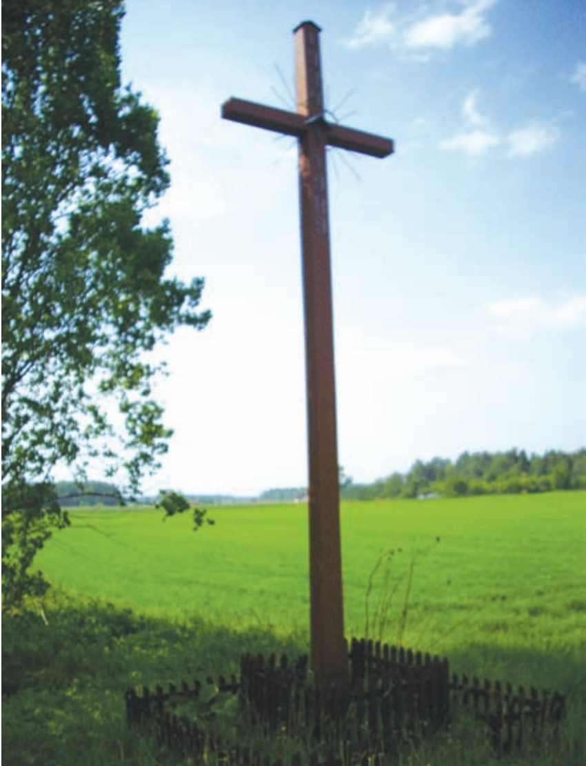
Medinis kryžius su įrašu „1939–1989“. Panevėžio–Pasvalio kelio 11 km