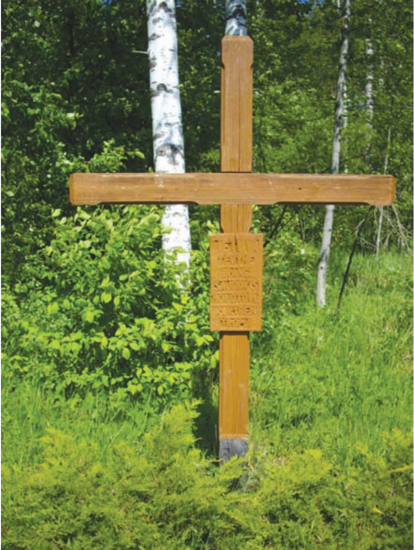
Medinis kryžius: „Lietuva, Tėvyne brangi, saugokis Molotovo ir Ribentropo“. 117 km