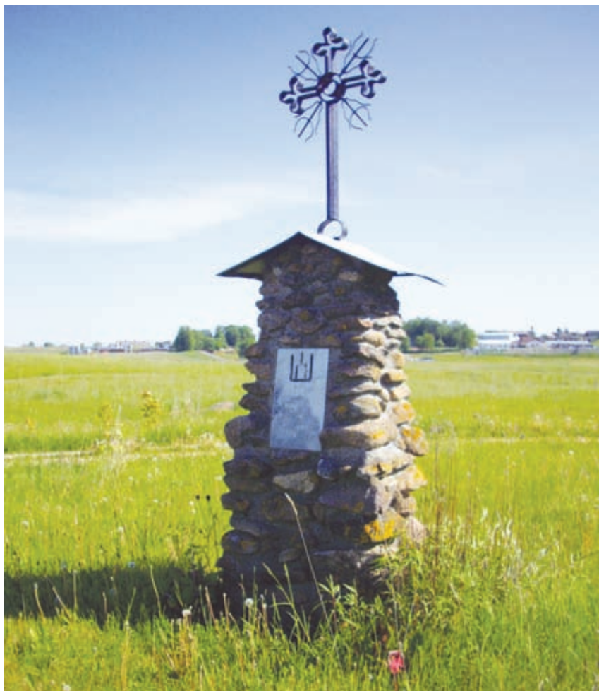
Paminklėlis: „Atgimstančiai Lietuvai 1989 VIII 23“. 16 km

Istoriko Romo Batūros fotografijos 2009 m. gegužės 27 d.