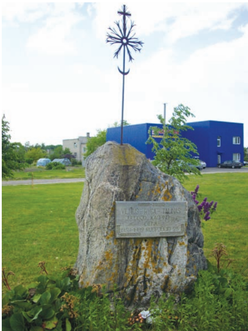
Paminklinis akmuo su saulute. Medinėje lentelėje įrašas: „Vilnius-Ryga-Talinas. Juodojo kaspino diena. 1939–1989 rugpjūčio 23“. Piniava