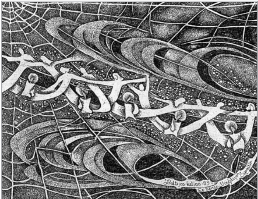
Dailininkės Gražinos Didelytės ekslibrisas „Baltijos kelias“