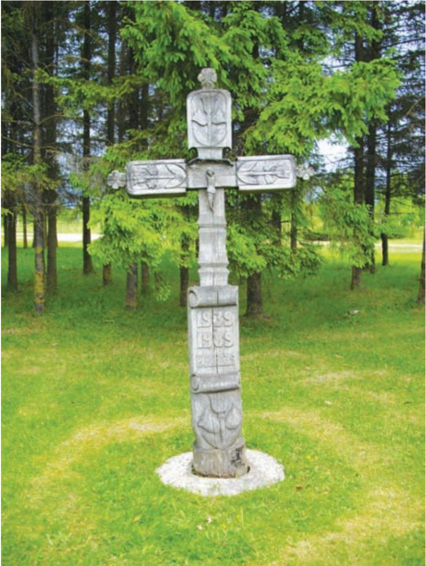
Medinis ornamentuotas kryžius Pasvalio memoriale: „1939–1989. Pakruojis“