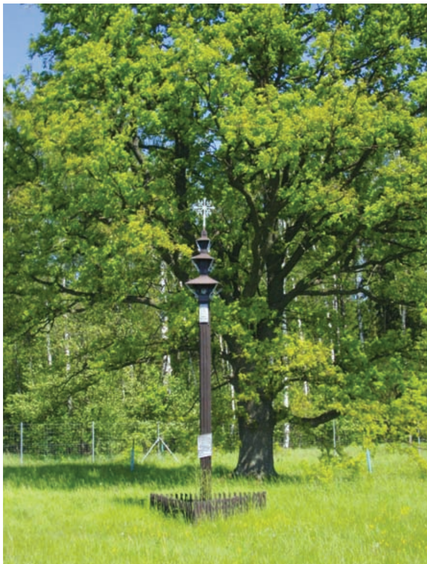
Stogastulpis ąžuolyne: „Nekaltai žuvusiems Lietuvos sportininkams. LTOK Kauno taryba 1989 VII 23“. 105 km