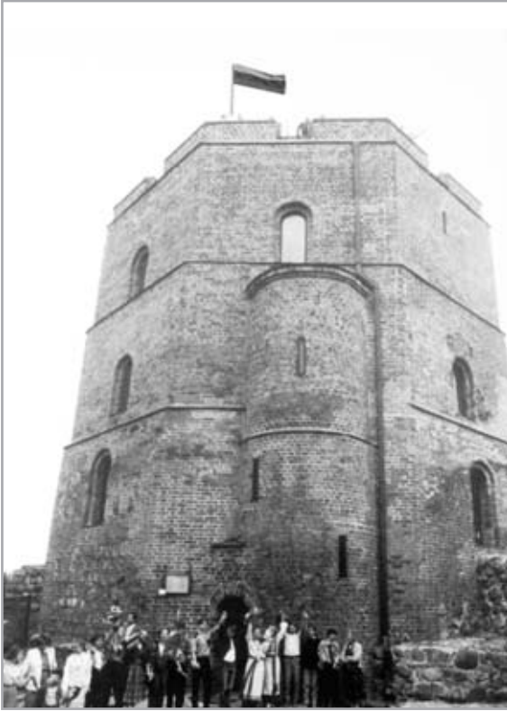
Vilnius. Gedimino pilies bokštas – Baltijos kelio pradžia