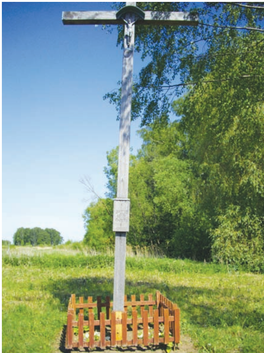
Medinis kryžius: „Baltijos keliui 10 metų. 1998 08 23“. 123 km