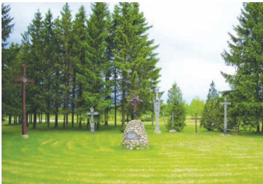
Memorialinis ansamblis Pasvalyje