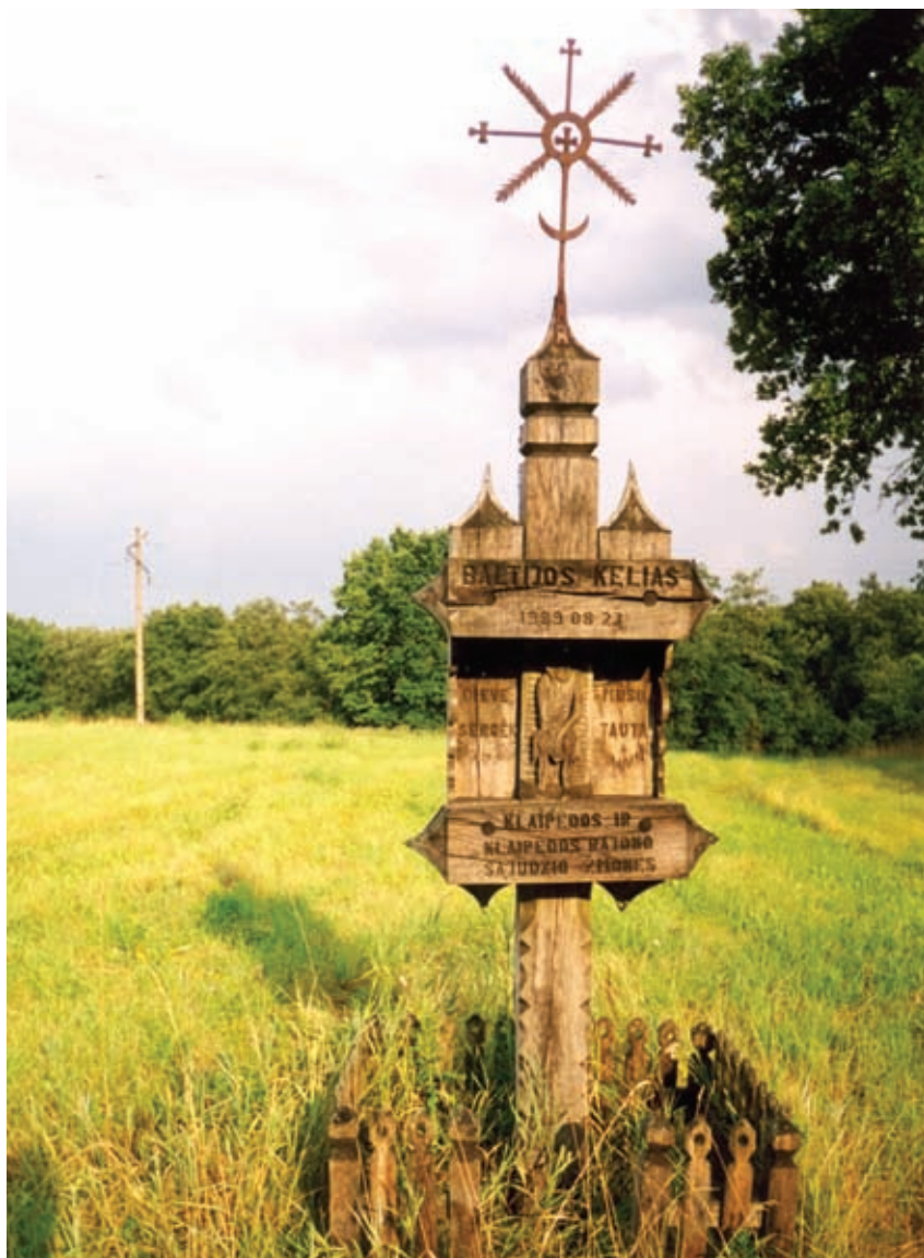
Stogastulpis su metaline saulute. Įrašai: „Baltijos kelias 1989 08 23“; „Dieve, sergėk mūsų tautą“; „Klaipėdos ir Klaipėdos rajono Sąjūdžio žmonės“. Prie Jiešmens upelio