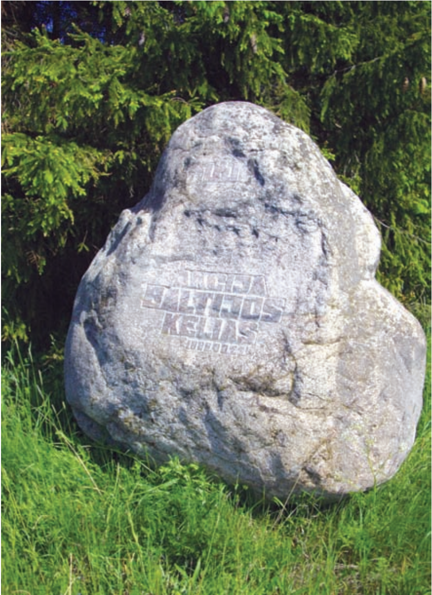
Ties Širvintų kryžkele: „Akcija Baltijos kelias 1989 08 23“