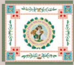
Didžiosios kunigaikštienės Birutės ulonų bataliono vėliava