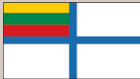
Karinių jūrų pajėgų vėliava