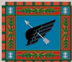
Karinių oro pajėgų Oro gynybos bataliono vėliava