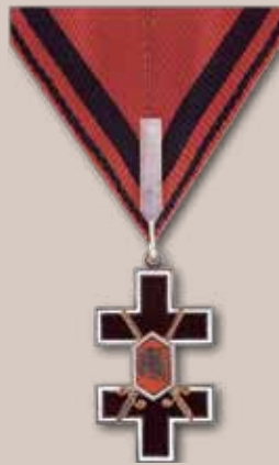
Vyčio Kryžiaus ordino Komandoro kryžius