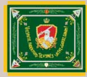
Karaliaus Mindaugo husarų bataliono vėliava