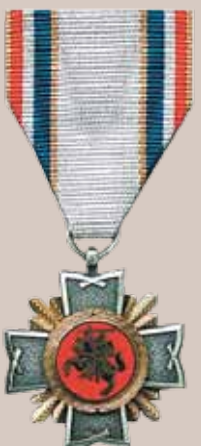
Lietuvos Respublikos krašto apsaugos sistemos medalis „Už pasižymėjimą“