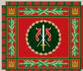
Generolo Adolfo Ramanausko kovinio rengimo centro vėliava

Šaltinis: http://kariuomene.kam.lt/lt/kariuomenes_atributika/kariuomenes_veliavos.html