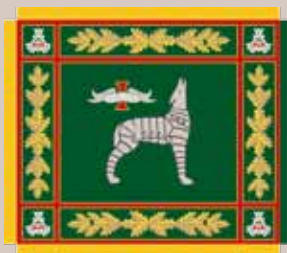
Mechanizuotosios pėstininkų brigados „Geležinis Vilkas“ vėliava