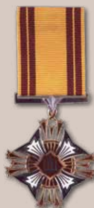
Lietuvos didžiojo kunigaikščio Gedimino ordino Riterio kryžius