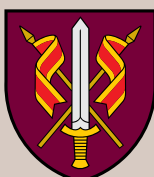
Generolo Adolfo Ramanausko kovinio rengimo centras