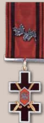
Vyčio Kryžiaus ordino Riterio kryžius