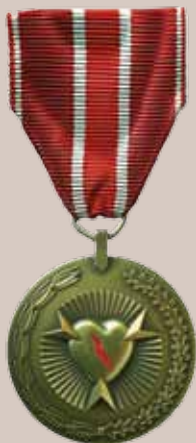
Lietuvos kariuomenės medalis „Sužeistajam“