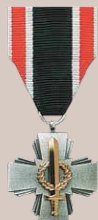
Lietuvos kariuomenės Karinių jūrų pajėgų medalis „Už pasižymėjimą“