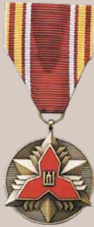
Kariuomenės pajėgų medalis „Už nepriekaištingą kariosavanorio tarnybą“ (išstarnavusiems KASP 5 metus)