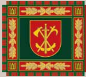
Juozo Vitkaus inžinerijos bataliono vėliava