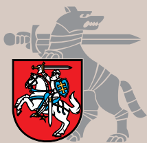
Krašto apsaugos ministerija