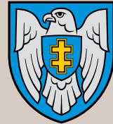
Karinių oro pajėgų Aviacijos bazė