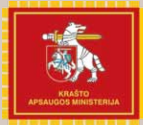
Krašto apsaugos ministerijos vėliava