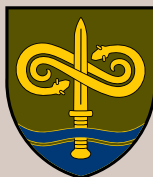
Kovinių narų tarnyba