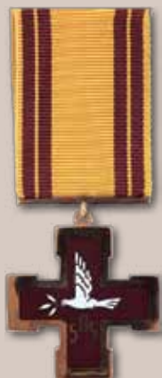
Žūvančiųjų gelbėjimo kryžius