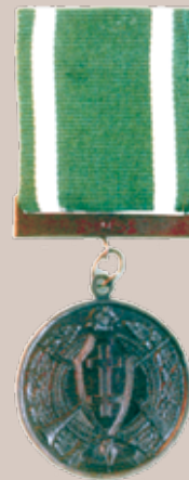
Šaulių žvaigždės medalis