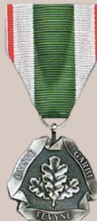
Lietuvos Respublikos krašto apsaugos sistemos medalis civiliams „Už nuopelnus“