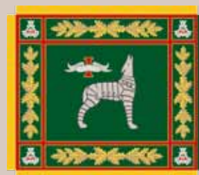
Specialiųjų operacijų pajėgų Vytauto Didžiojo jėgerių bataliono vėliava