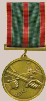
Lietuvos kariuomenės kūrėjų savanorių medalis