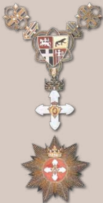
Vytauto Didžiojo ordinas su aukso grandine