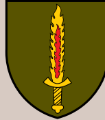
Specialiųjų operacijų pajėgos