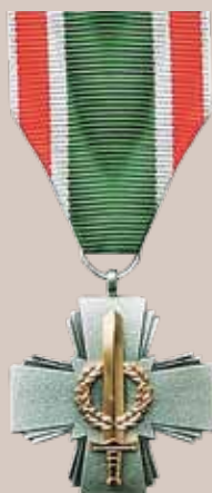
Lietuvos kariuomenės sausumos pajėgų medalis „Už pasižymėjimą“