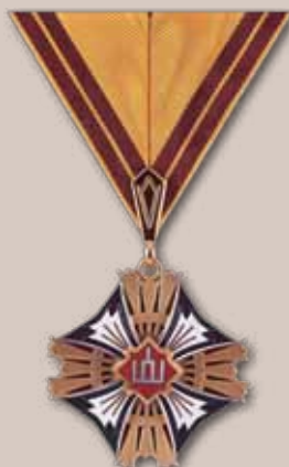
Lietuvos didžiojo kunigaikščio Gedimino ordino Komandoro kryžius