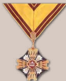
Lietuvos didžiojo kunigaikščio Gedimino ordino Komandoro didysis kryžius