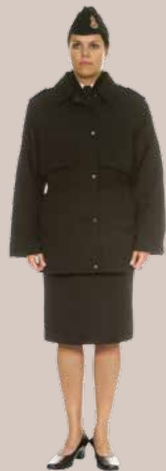
Ceremonijų uniformos, skirtos dėvėti iškilmingų rikiuočių metu, valstybinių švenčių dienomis, iškilmingų susirinkimų, oficialių (diplomatinių) priėmimų, tarnybos metu ir kitais atvejais tarnybos viršininko (karinio vieneto vado) įsakymu