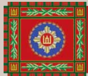
Karo policijos vėliava