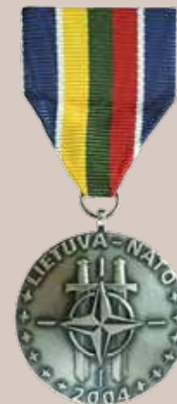
Lietuvos Respublikos krašto apsaugos sistemos proginis stojimo į NATO medalis