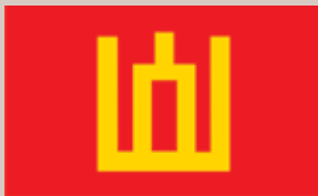
Sausumos pajėgų vėliava