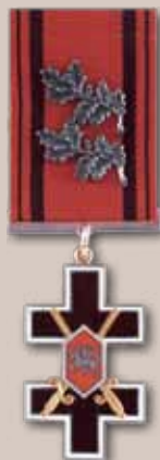
Vyčio Kryžiaus ordino Karininko kryžius