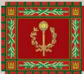
Sausumos pajėgų vadovybės vėliava