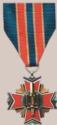
Lietuvos kariuomenės medalis „Už nuopelnus“