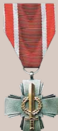
Lietuvos kariuomenės Krašto apsaugos savanorių pajėgų medalis „Už pasižymėjimą“