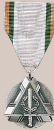
Kariuomenės pajėgų medalis „Už pavyzdinę tarnybą“