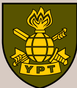
Ypatingosios paskirties tarnyba