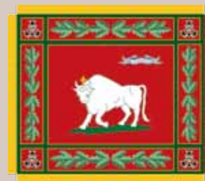
KASP Dariaus ir Girėno apygardos 2-osios rinktinės vėliava