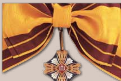
Lietuvos didžiojo kunigaikščio Gedimino ordino Didysis kryžius