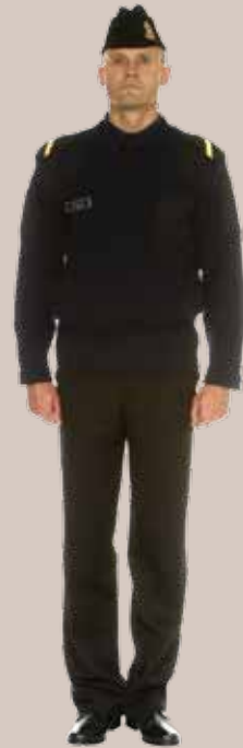
Jūreivio ceremonijų uniformos, skirtos dėvėti KJP kariams iki jaunesniojo seržanto