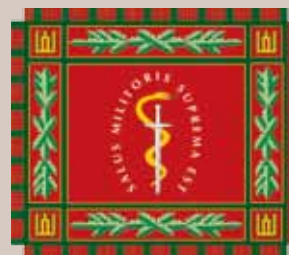
Karo medicinos tarnybos vėliava