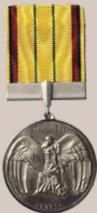
Sausio 13-osios medalis