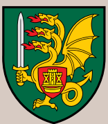
LDK Butigėdžio dragūnų batalionas