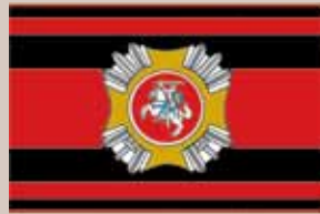
Lietuvos kariuomenės vado vėliava