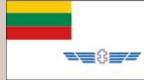
Karinių oro pajėgų vėliava