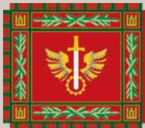
Logistikos valdybos vėliava