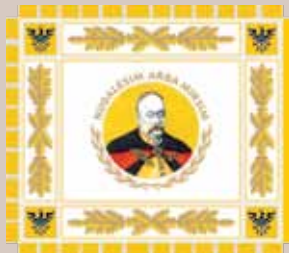
Didžiojo Lietuvos etmono Jonušo Radvilos mokomojo pulko vėliava