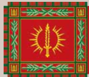
Specialiųjų operacijų pajėgų vėliava