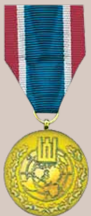
Lietuvos Respublikos krašto apsaugos sistemos medalis „Už tarptautines misijas“