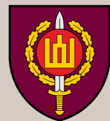
Divizijos generolo Stasio Raštikio Lietuvos kariuomenės mokykla