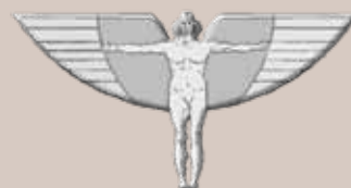
Karinių oro pajėgų orlaivio vado ženklas ir orlaivio vado garbės skiriamasis ženklas