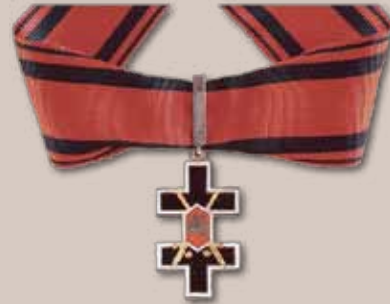
Vyčio Kryžiaus ordino Komandoro didysis kryžius