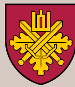
Krašto apsaugos savanorių pajėgos