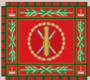
Generolo Romualdo Giedraičio artilerijos bataliono vėliava