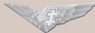
Lietuvos karo aviacijos garbės ženklas „Plieno sparnai“ (1932 m.)