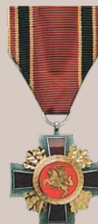
Lietuvos Respublikos krašto apsaugos sistemos generolo Jono Žemaičio medalis