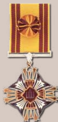
Lietuvos didžiojo kunigaikščio Gedimino ordino Karininko kryžius