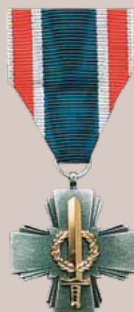
Lietuvos kariuomenės Karinių oro pajėgų medalis „Už pasižymėjimą“