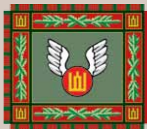
Judėjimo kontrolės centro vėliava