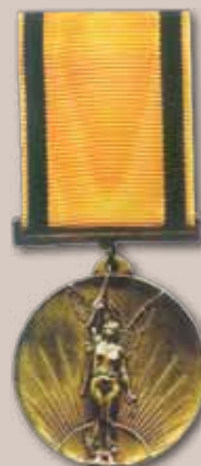
Lietuvos nepriklausomybės medalis