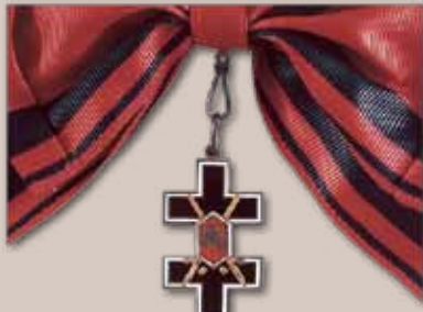
Vyčio Kryžiaus ordino Didysis kryžius