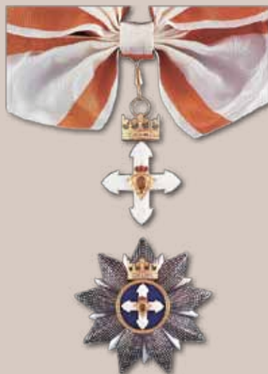
Vytauto Didžiojo ordino Didysis kryžius