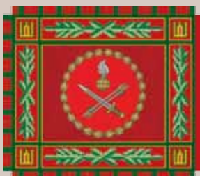
Specialiųjų operacijų pajėgų Ypatingosios paskirties tarnybos vėliava