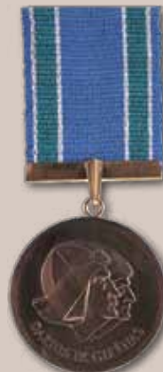
Dariaus ir Girėno medalis