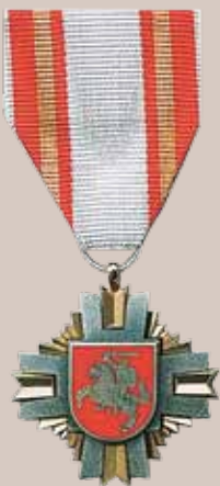
Lietuvos Respublikos krašto apsaugos sistemos medalis „Už nuopelnus“