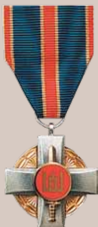
Lietuvos kariuomenės medalis „Už pasižymėjimą“